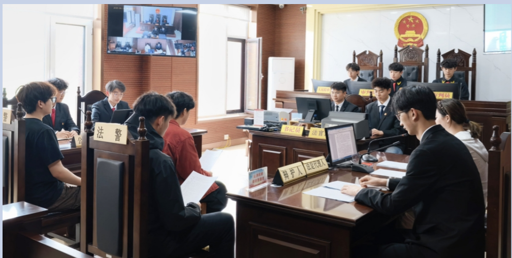
▲ 4月14日，淄博市周村区人民法院文昌湖法庭邀请大学生走进审判庭，沉浸式参与模拟法庭活动。