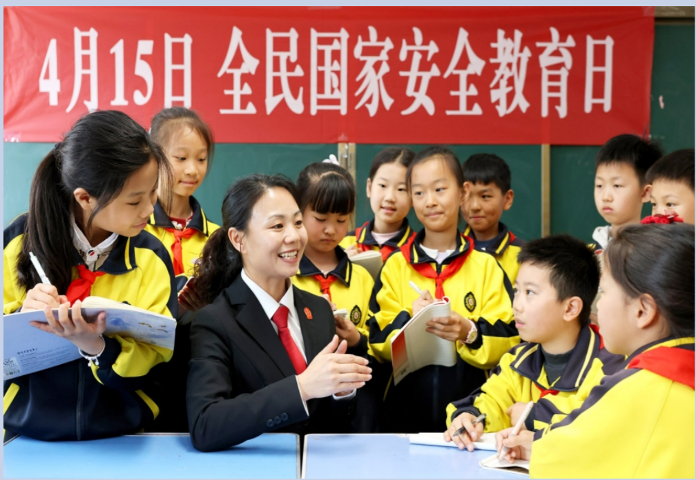
▲ 4月15日，枣庄市市中区人民法院法官在文化路小学给学生们讲解国家安全相关法律法规知识。