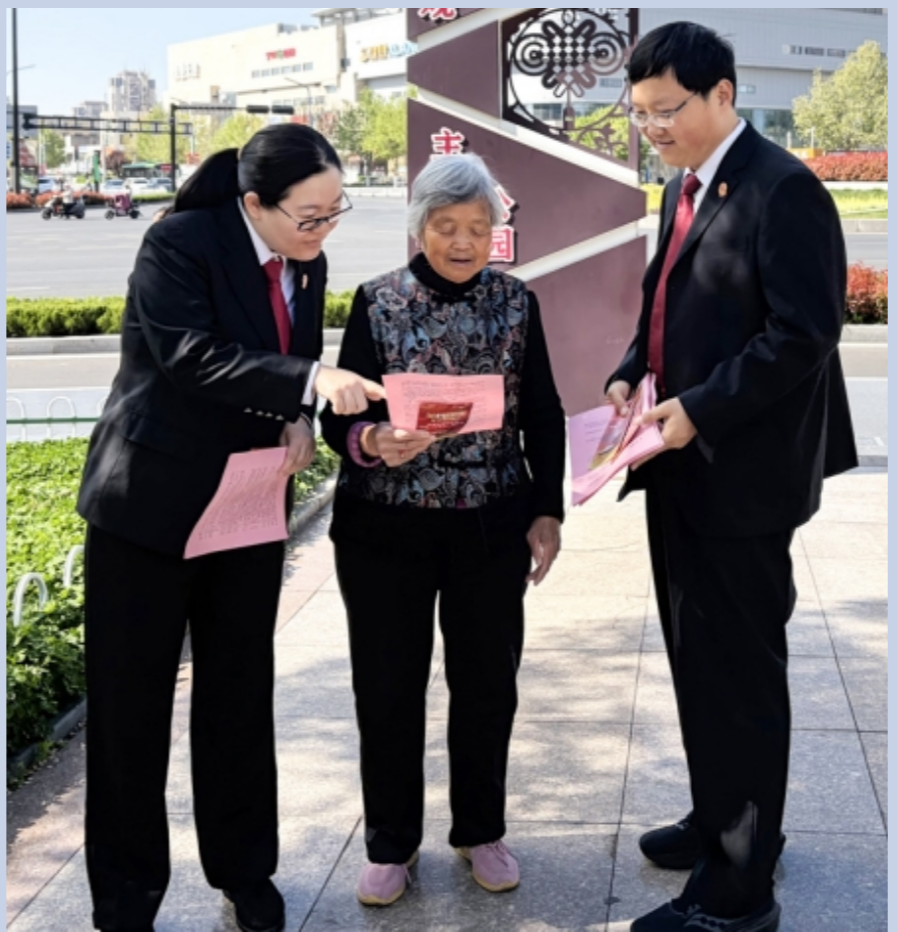
▲ 4月13日，济南市莱芜区人民法院干警走进总体国家安全观主题公园开展专题普法宣传活动。温强 张琪 摄