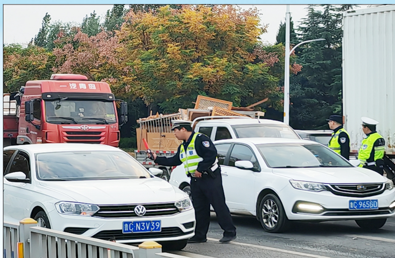
淄博临淄交警开展酒驾整治行动。

淄博交警不仅严格执法，还暖心服务群众。10月2日，博山交警接到群众求助，一名外地来淄博游玩的老人不慎摔倒，情况危急。执勤民警立即启动应急护送机制，通过警笛和喊话器引导沿途车辆避让，仅用10分钟便将老人安全护送至医院，为救治赢得了宝贵时间，受到群众的一致赞誉。