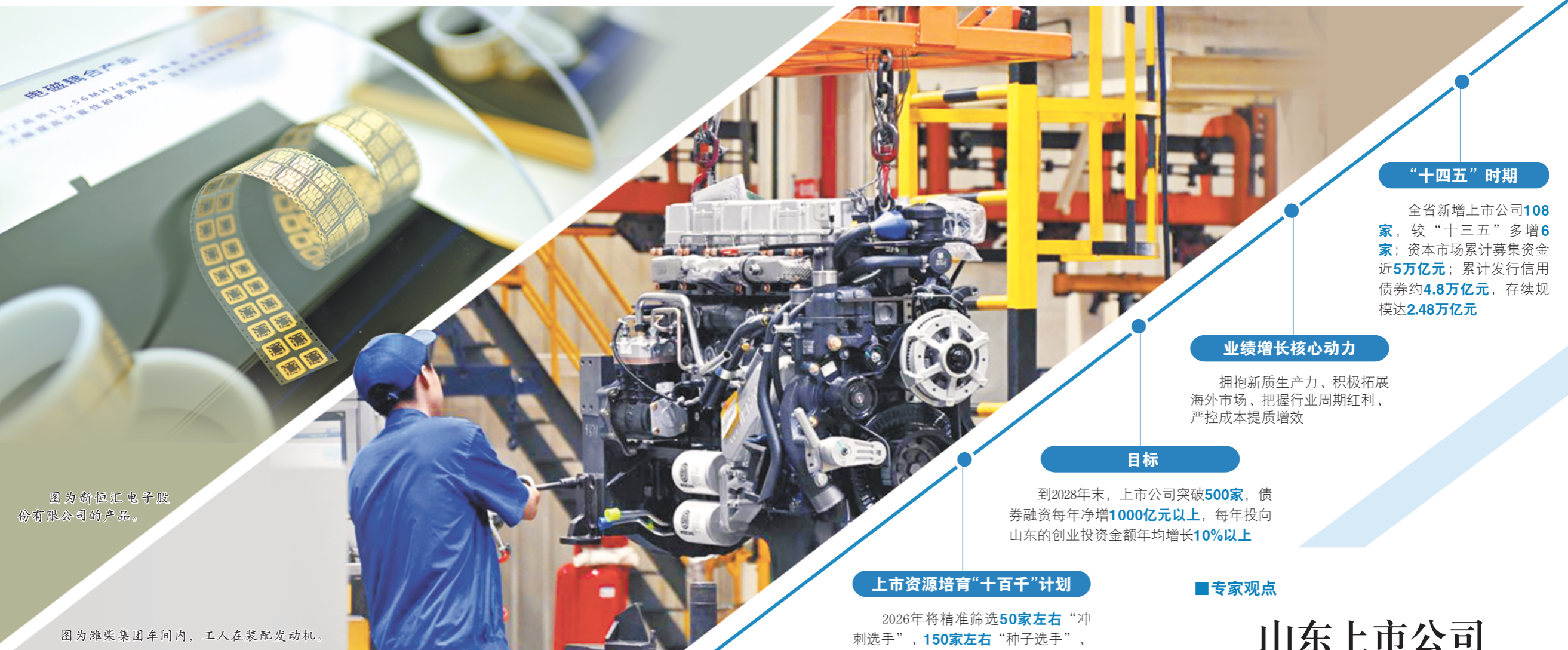
图为新恒汇电子股份有限公司的产品。