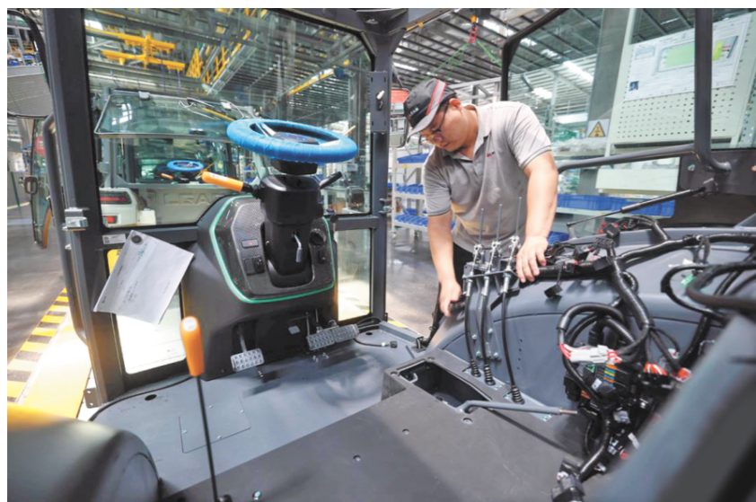
图为临沂市兰山区临工智慧农机装备产业园的流水线上，工人在组装拖拉机。