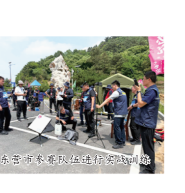
山东省应急指挥保障业务“百日实战化练兵比武”竞赛开幕式