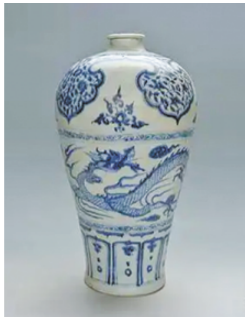
元·青花龙纹梅瓶 菏泽市博物馆藏

现藏于菏泽市博物馆的元青花龙纹梅瓶，就是那个躲过了沉船撞击以及装修施工的“幸运儿”。这件梅瓶高42.5厘米，口径6.3厘米，底径14.6厘米，个头不小、挺拔庄重，圆肩饱满，小口、短颈、平底，圈足微微外展，胎体较厚，釉面白中透青，通体青花装饰却满而不乱，彰显着元青花的独特审美。