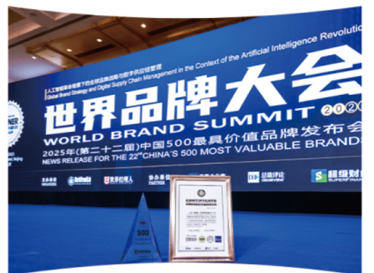
2025年世界品牌大会上，青岛银行再度跻身“中国500最具价值品牌”榜单