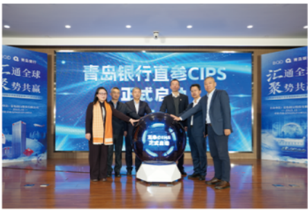
多方代表共同参与CIPS直参启动仪式

2025年，青岛银行完成山东省16市全域覆盖，资产总额突破8000亿元，管理总资产突破万亿元，不良贷款率降至0.97%。在行业转型的深水期，这家城商行既做服务实体经济的主力军，也当温暖万家的贴心人。