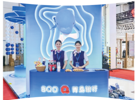
2025年6月，作为CIPS展区唯一参展山东地方银行，青岛银行精彩亮相国际金融展

一群西藏少年，在雪域高原的足球场上奔跑、在蓝天白云下踢球，交到了来自黄海之滨的朋友。这是青岛银行“山海相望·青银圆梦”足球冬令营活动的一幕，把关爱从海滨青岛延伸到雪域高原，传递的不是资金，是跨越山海送达的温暖。