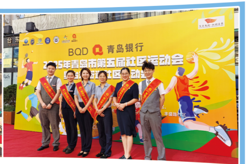
参与社区运动会志愿服务活动