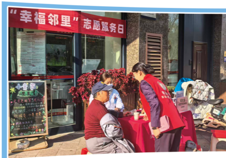
青山路社区支行爱心义诊服务