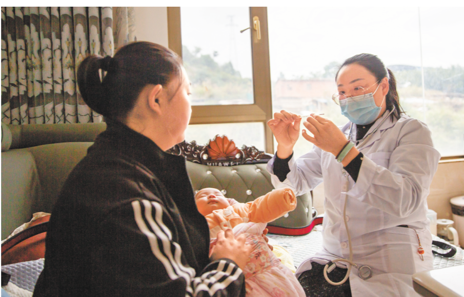
近日，云南省曲靖市沾益区龙华街道新龙社区的村医为社区孕产妇和儿童进行入户随访。（□新华社发）

5月7日，国家卫生健康委等8部门公布《关于改革完善儿童用药供应保障机制的实施意见》，从研发源头到临床使用，从生产供应到支付保障，全面提高儿科供药用药能力，让儿童用药更有保障更安全。 研出新路，让儿童有新药、好药用—— 儿童并非成人的“缩小版”，其脏器发育、药物代谢具有特殊性。长期以来，适合儿童的专用药品少、适宜剂型规格缺等问题突出，成为临床诊疗和家长心中的“痛点”。 实施意见将“创新研发支持”摆在首位，直击源头短板。 完善鼓励研发申报儿童药品清单和激励仿制药目录配套政策，对纳入其中的儿童用药予以优先审评审批等；加强儿童用药审评审批全过程充分沟通交流，早期介入、研审联动，允许滚动提交资料，持续提升研发效率…… 一系列政策将重点为儿童专用创新药、罕见病用药、重大疾病防治用药以及符合儿童特点的新剂型新规格研发“提速”。 根据实施意见，探索组织建立全国儿童临床试验协作网和跨机构伦理审查机制，集中资源、协同招募研究参与者，整体提升儿科临床试验机构规范化管理水平。 同时，引导医疗机构对适宜儿童使用但缺乏儿童用药信息的药品开展协同研