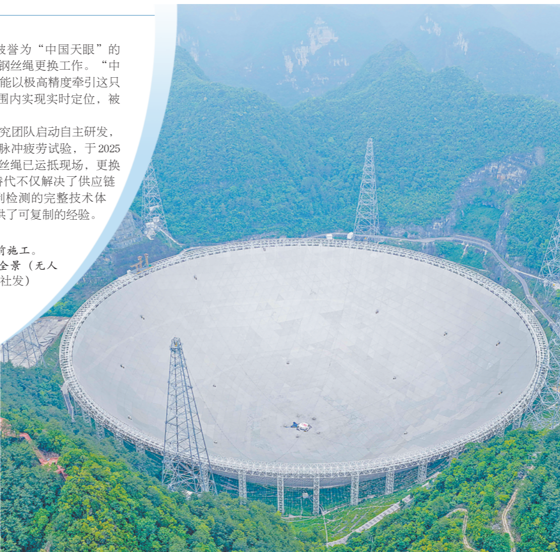
左图：5月6日，工作人员在馈源舱前施工。 右图：5月6日拍摄的“中国天眼”全景（无人机照片，维护保养期间拍摄）。（□新华社发）

据新华社贵阳5月7日电 近日，被誉为“中国天眼”的500米口径球面射电望远镜启动馈源驱动钢丝绳更换工作。“中国天眼”的馈源舱重达30吨，6根钢丝绳能以高精度牵引这只“眼球”，在140米高空、206米尺度范围内实现实时定位，被称为“中国天眼”的“眼部肌肉”。 此前该部件依赖进口，2023年1月研究团队自主研发，经3轮迭代、6.2万次滑轮运行及20万次脉冲疲劳试验，于2025年8月成功实现国产化。目前6根国产钢丝绳已运抵现场，更换工作预计持续至6月下旬。此次国产化替代不仅解决了供应链安全问题，更建立了从材料、制绳、评价到检测的完整技术体系，为其他重大科技基础设施的国产化提供了可复制的经验。