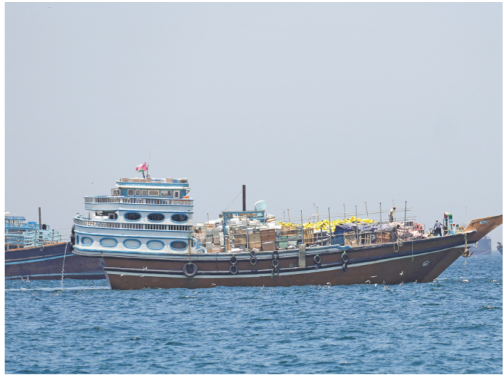
5月4日在阿曼穆桑代姆拍摄的霍尔木兹海峡上的船只。

新华社纽约5月4日电 (记者 刘亚南) 受美国海军军舰被伊朗军队导弹击中的传闻影响，国际原油期货价格4日早间一度大幅上涨超过5%，但随后回吐涨幅。