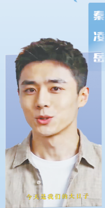
今天是我们的天日子