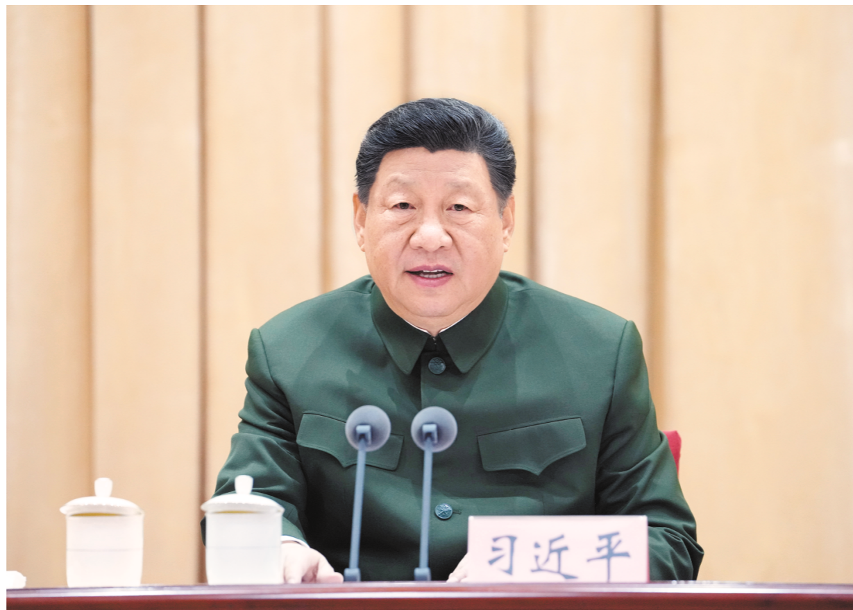
4月8日上午，全军高级干部培训班在国防大学开班。中共中央总书记、国家主席、中央军委主席习近平出席开班式并发表重要讲话。

中央军委副主席张升民主持开班式。第一期全军高级干部培训班学员，军委机关各部门、军队驻京有关单位主要负责同志等参加。开班式以电视电话会议形式组织，在全军相关军级以上单位设分会场。