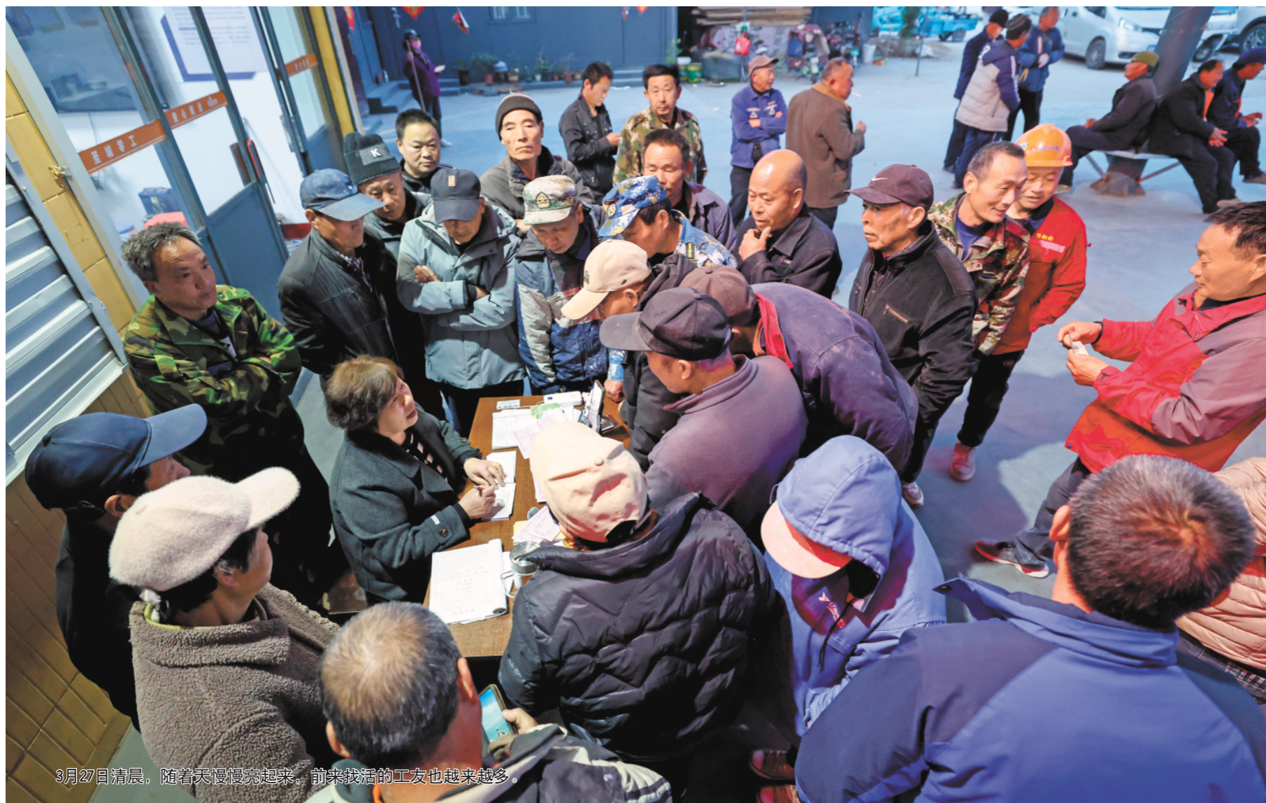
3月27日清晨，随着天慢慢亮起来，前来找活的工友也越来越多。