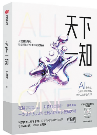
□ 本报记者 蔡可心

日前,两届文津图书奖得主、知名科普作家、AI科技公司创始人严伯钧所著的《天下—知》举办新书首发活动。