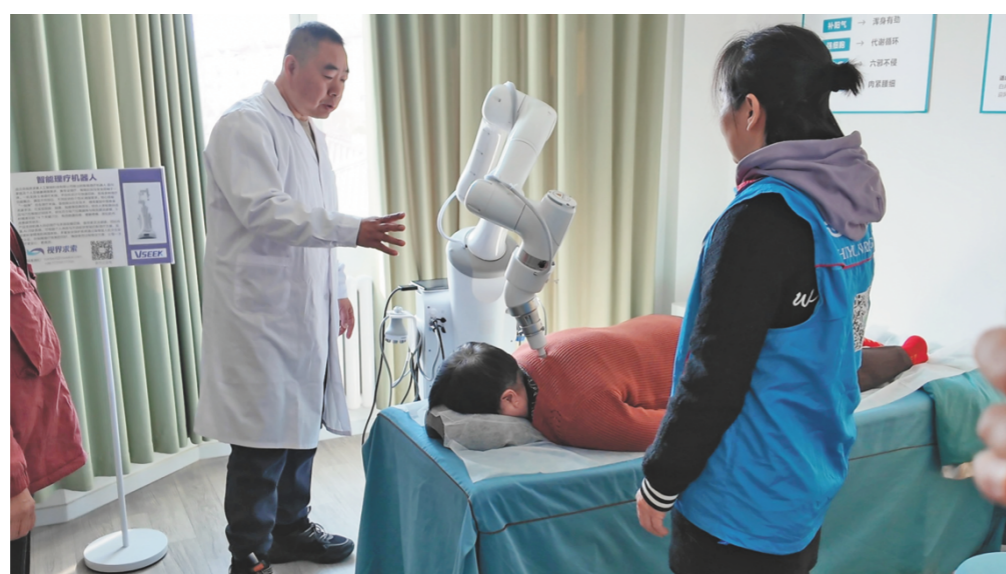
近日，社区居民在全球首个智慧康养驿站体验按摩机器人。(□ 田柳 报道)

张女士体验过“一指禅”按摩仪，感觉很不错。她告诉记者，在和机器人接触的过程中，自己没有感觉到阻碍和不适。人工手法