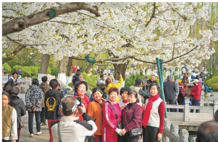
□新华社记者 徐建绘 报道 3月24日,游客在济南市五龙潭公园内赏花拍照。

G308文石线章丘水寨至黄家段改建工程全长约18.9公里,双向六车道一级公路标准建设,是济南市“四港三区联动”枢纽新城交通网北端关键通道。截至目前,该项目整体推进顺利,路基工程完成24%,路面工程已完成水稳基层、柔性基层及下面层试验段铺设,桥梁工程已完成30%。S31泰新改扩建项目全长66.41公里,概算投资58.9亿元,2025年6月正式开工建设。项目依托19项管理制度体系和数字化管理平台,发挥毗邻钢铁密集区域的区位优势,重点推进钢渣沥青混合料、废旧铣刨料高值利用、耐久性冷再生混合料应用、零碳智慧工厂及零碳收费站建设等技术攻关。