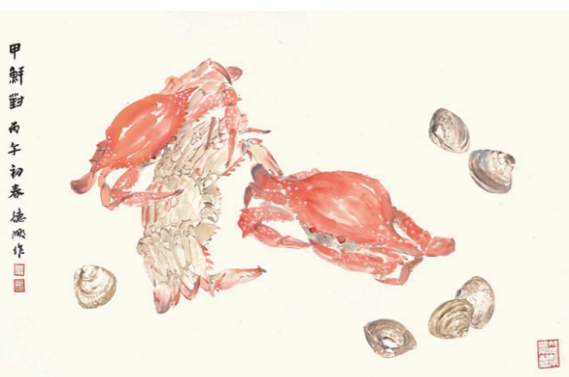
《甲鲜对》 45cm×69cm 2025年