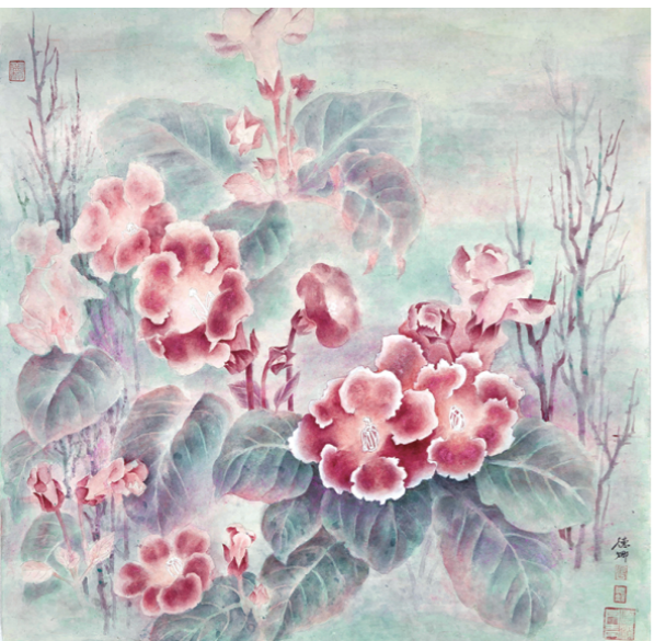
《法国梧桐》 67cm×65cm 2025年