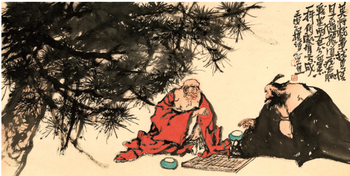
《对弈》 68cm×138cm 张宜