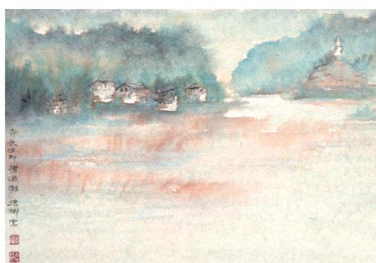
《青衣江畔 槽鱼滩》 26cm×37cm 2025年