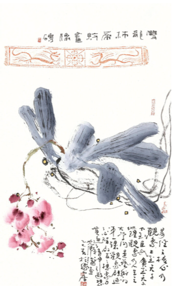
蝶恋花 69cm×46cm 沈光伟