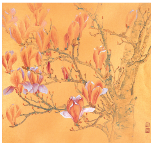
《首芳》 50cm×50cm 2017年

展览以“花开圣境”为主题，以浪漫主义和现实主义结合的情怀，运用花鸟画创作的理念和技法，营造了明亮、祥和、深远的艺术氛围，弘扬天人合一、生生不息的中华优秀传统文化，让运河之畔的水城聊城，浸润在丹青雅韵之中。