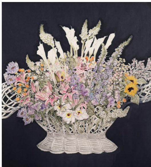
《如意百卉》 150cm×162cm 2021年