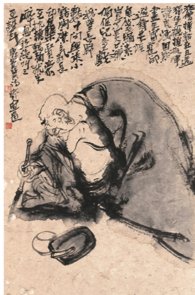
《狂僧挥翰狂且逸》 46cm×30cm 张宜