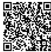
扫描二维码观看陆林院士直播内容

2021年，山东省精神卫生中心睡眠医学专科联盟成立，并召集省内96家医疗机构加入，每两个月作一次线上培训，分享行业最新进展和专业医生经验。未来，远程会诊平台、报告判读支持将借助联盟落地。