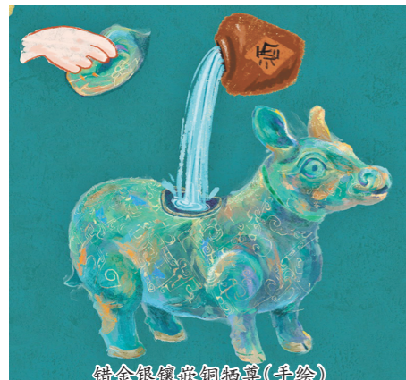
错金银嵌铜牺尊(手绘)

编者按 当“好客山东·齐鲁1号”文物研学主题旅游列车驶出,一座“移动的博物馆”就此启程。