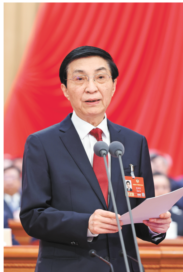
3月11日上午，中国人民政治协商会议第十四届全国委员会第四次会议在北京人民大会堂闭幕。全国政协主席王沪宁主持闭幕会并讲话。