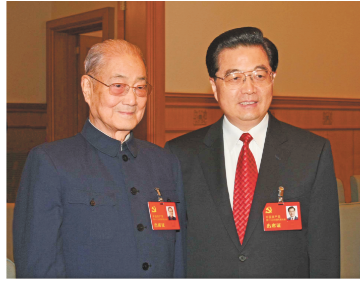
2007年10月21日，在党的十七大闭幕前，胡锦涛同志同宋平同志在一起。