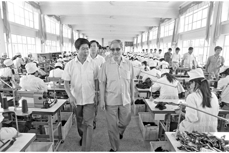
1990年8月14日，宋平同志（右）在山东省威海市文登区考察。