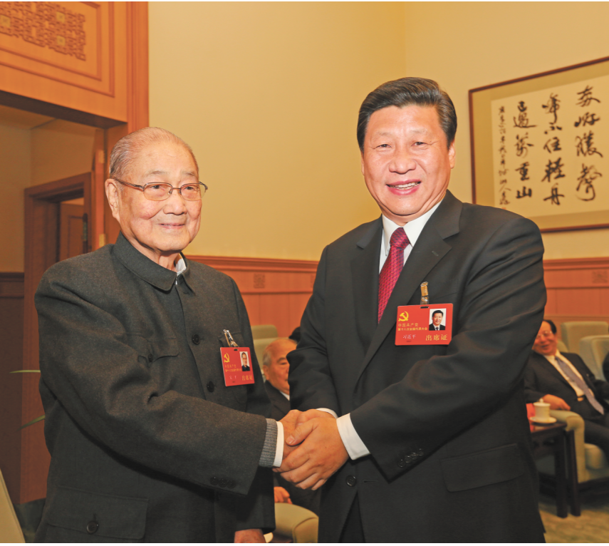
二〇一二年十一月十四日，在党的十八大闭幕前，习近平同志同宋平同志在一起。