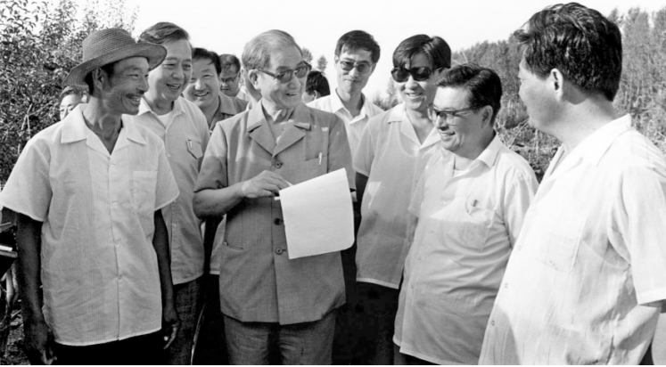
1990年7月中旬，宋平同志（左二）来到内蒙古自治区巴彦淖尔市临河区马场地村了解基层党支部建设情况。