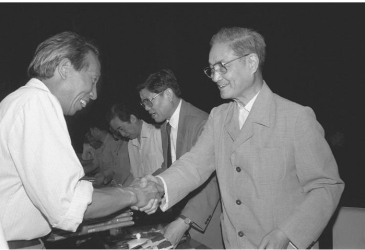
1991年6月26日，中共中央组织部、中共中央宣传部等单位在北京召开大会，表彰全国高校优秀思想政治工作者。这是宋平同志（右）向获奖的个人颁奖。