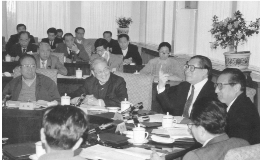
1991年4月，江泽民同志、宋平同志（前排左二）等与参加党建理论讨论会的代表座谈。