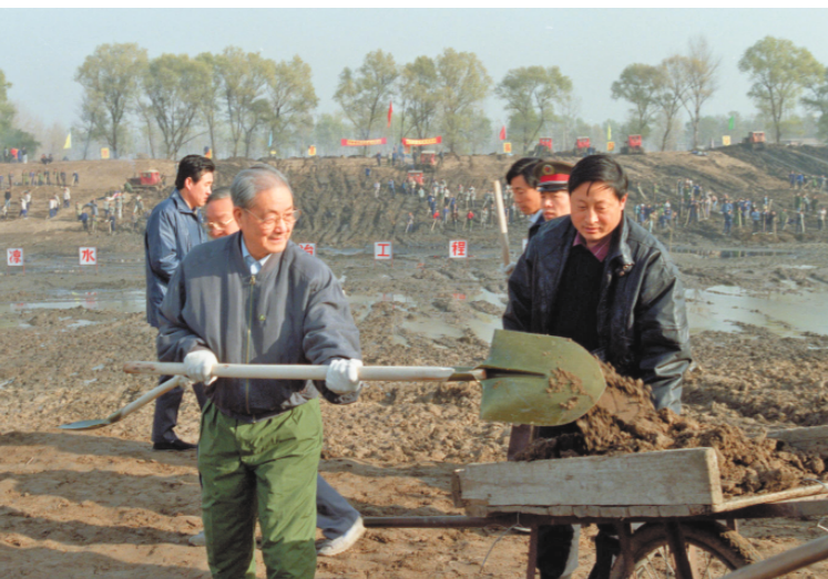
1991年11月13日，宋平同志（左）来到北京市通州区张家湾凉水河整治工地参加劳动。