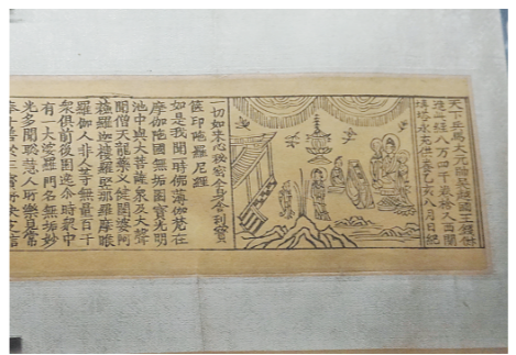
▲五代《宝篋印陀罗尼经》(局部)

钱俶当政时，吴越国辖十三州一军之地，相当于今浙江省、上海市全境和江苏东南部的苏州、福建北部的福州等地。吴越国虽然存续时间不长，又主要活跃在南方，但是在山东也有一些遗存，本次特展就有这样一件文物亮相。