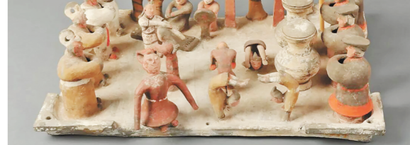
▲西汉彩绘乐舞杂技俑

这21个陶俑分工明确：七人在中央表演，七人在后方奏乐，另有七人在两侧观赏，构成一台结构完整的“微型演出”。