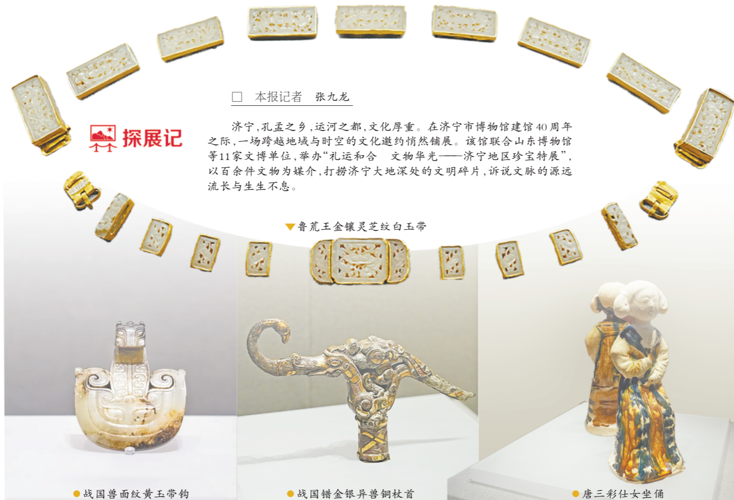
□ 本报记者 张九龙