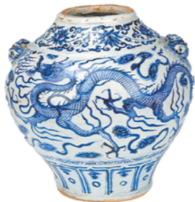
●元青花云龙缠枝莲纹罐

还有那件水晶鹿镇纸，以整块水晶琢成，质地纯净莹澈。鹿的造型惟妙惟肖，昂头伸颈，弓背伏卧，半睁双眼，双耳贴脑，仿佛下一秒便会起身奔跑。