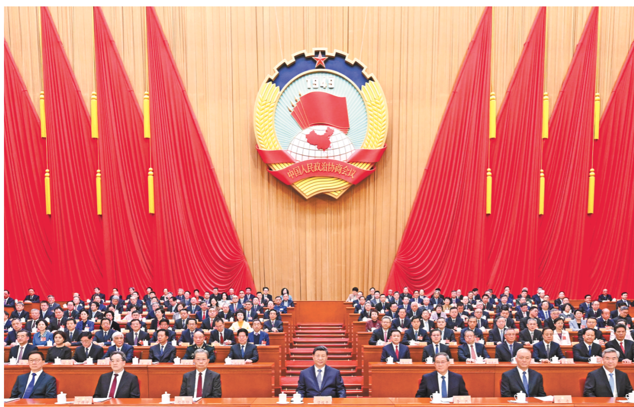
3月4日下午，中国人民政治协商会议第十四届全国委员会第四次会议在北京人民大会堂开幕。这是习近平、李强、赵乐际、蔡奇、丁薛祥、李希、韩正在主席台就座。

王沪宁表示，2025年是中国式现代化进程中具有重要意义的一年。面对错综复杂的国际形势和艰巨繁重的国内改革发展稳定任务，以习近平同志为核心的中共中央团结带领全党全国各族人民，迎难而上、奋力拼搏，统筹国内