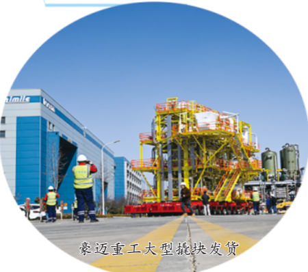
豪迈重工大型模块发货