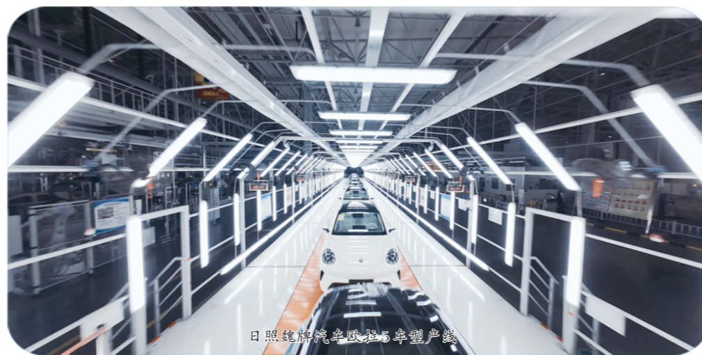
日照魏牌汽车欧拉5年产量线

新兴产业势头更猛，生物化工新材料产业已集聚泰医械、瑞桥新材料等20家投产企业，鑫辉新材料、星联药业等项目扎实推进，产业链条不断延伸。新能源和海工装备产业方面，中船金马等项目加快推进，特别是近海海域火箭发射成为城市新IP，全国首个半潜式火箭发射专用平台项目签约落地，为产业升级打开了全新空间。