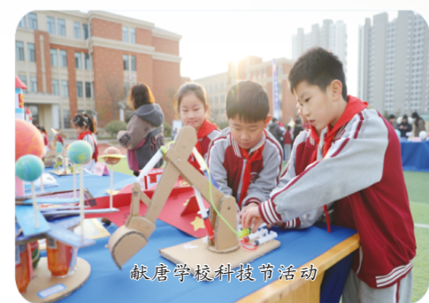
铁店学校科技节活动