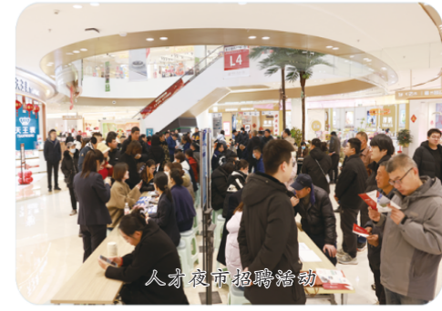
人才夜市招聘活动

单”变为百姓触手可及的“幸福账单”。公共服务扩容提质，筑牢幸福根基。教育是民生之基，日照经开区全年新聘教师49人，秦皇岛路中学、长春路小学建设稳步推进，7所校舍完成改造提升，免费学前教育政策惠及2000余名幼儿。医疗是民生之需，20处社区卫生室完成升级改造，家庭医生签约服务覆盖11.8万余人，规划7处安置区社区服务中心用房，设立10个社区慈善基金，健康守护网越织越密。安居是民生之盼，成都路社区等一批安置房顺利分配到户，33个老旧小区焕发新颜，23个村居城乡供水一体化工程全面完工，34项市政工程刷新城市颜值，群众居住条件显著改善。