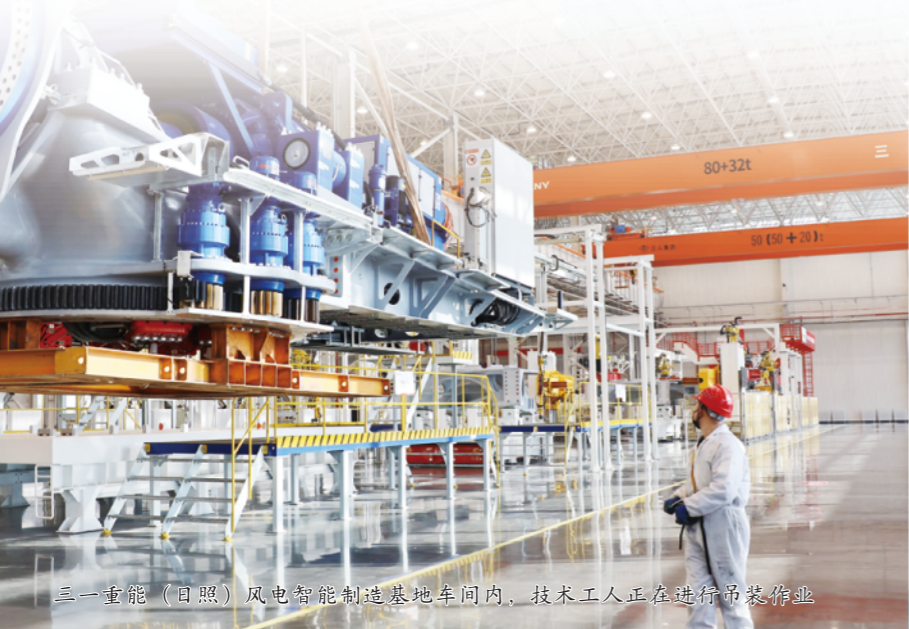
三一重能(日照)风电智能制造基地车间内,技术人员正在进行吊装作业

站在“十五五”新起点，日照经开区已鸣枪开跑，确立了招引700个项目、纳统200家“四上”企业的进取目标。这展现的不仅是魄力，更是对“经济发展第一战场、对外开放第一高地、‘三生合一’第一园区”战略目标的坚定奔赴。期待这片热土继续乘风破浪，谱写新的辉煌篇章。