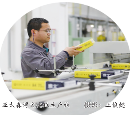
亚太森博文化纸生产线