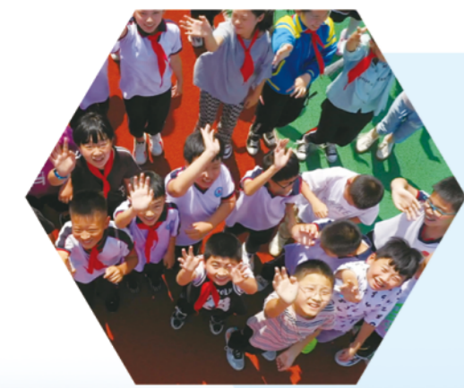
充满朝气的岚山校园