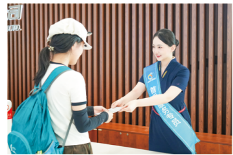
真情真心 待客如亲

客流再创新高，是济南机场发展历程中的里程碑，更是未来高质量发展的新起点。随着济南机场航线网络的进一步拓展与航旅融合的深度推进，济南机场将继续以航线网络为纽带、以航旅融合为核心、以服务品质为支撑，深化民航与文旅产业协同发展，既让航空运输成为文化旅游的“快速通道”，又让文化旅游反哺成为航空运输的“流量引擎”，不断提升区域性综合航空枢纽的辐射力与影响力，书写航旅协同发展的新篇章。