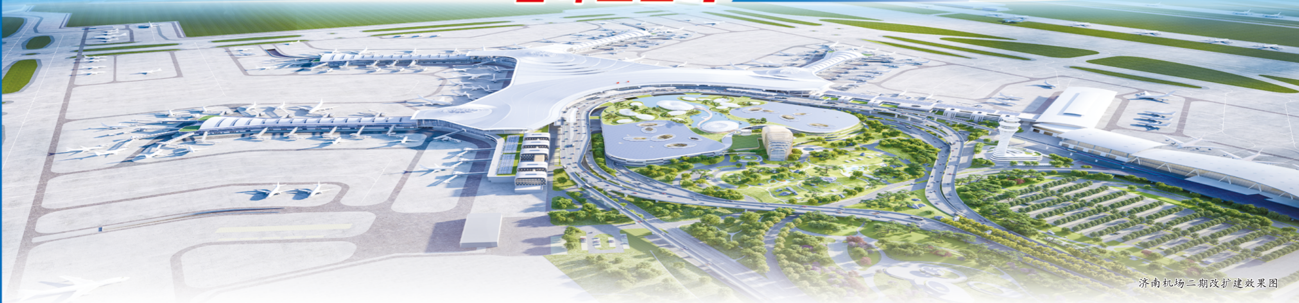
济南机场二期改扩建效果图