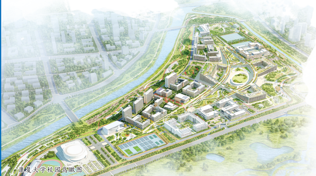
康复大学校园鸟瞰图

这股“新”气，正驱动康复大学向着“高起点、小而精、研究型、国际化”的方向坚实迈进，书写“康之所向，大有可为”的崭新篇章。