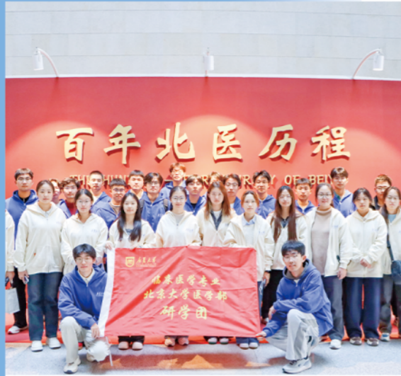
学生赴北京大学医学部开展专业学习实践