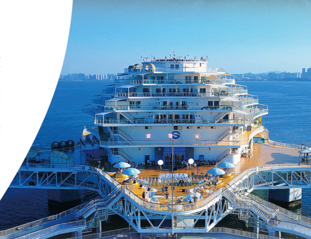
“耕海一号”海洋牧场综合平台