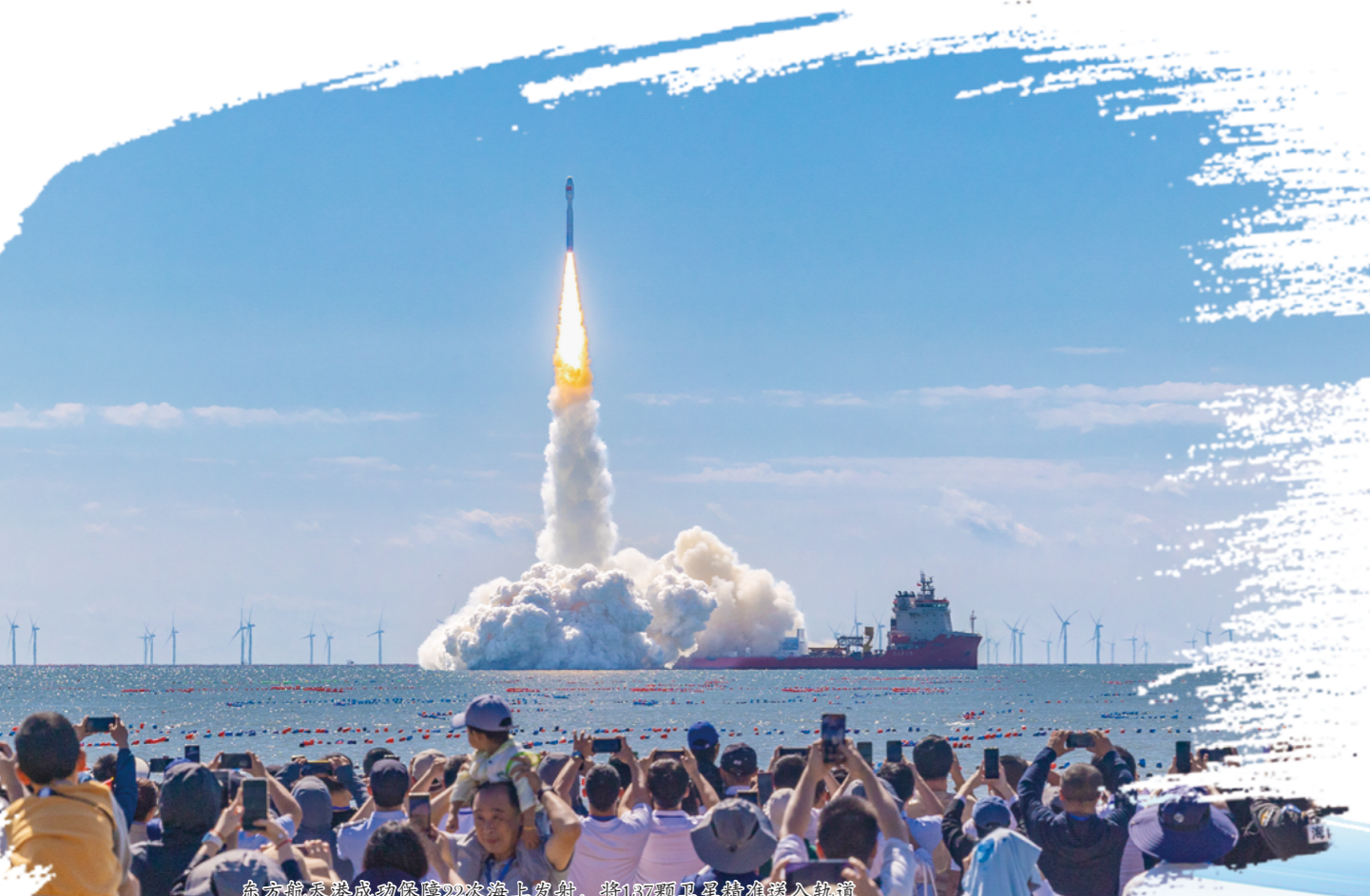
裕龙岛炼化一体化项目2023年投产，烟台工业转型升级驶入快车道。

新旧动能转换常被视为“取舍难题”，不少地方顾虑转型阵痛影响发展指标而踟躇不前。“十四五”时期，烟台以坚定的战略定力推进转型，不仅未放缓发展脚步，还实现了地区生产总值连跨4个千亿级台阶，成为北方首个万亿地级市。烟台的实践印证了“方向对了，路就不远”。烟台的“破”，是向传统路径开刀。作为工业大市，烟台没有沉迷于既有产业红利，而是以裕龙岛炼化一体化、万华（蓬莱）新材料低碳产业园等项目为标杆，推动传统产业向高端集约转型，让