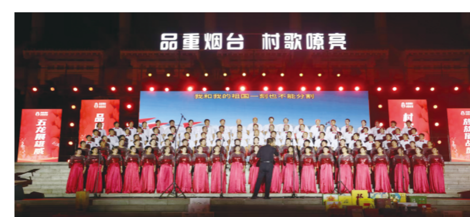
2025烟台村歌大赛赛成一种现象级乡村文化赛事

台作用，入企检查次数压减33%。开放赋能拓空间，双向投资合作提质增效。2025年，全国首创试保混金业务，对欧盟、共建“一带一路”国家进出口分别增长26.7%、131%。新增国际友城4个。举办重大招商活动20余场，引进千万美元项目30个，万华科威特股权投资到资6.38亿美元，是全省近年来最大的单体外资项目。