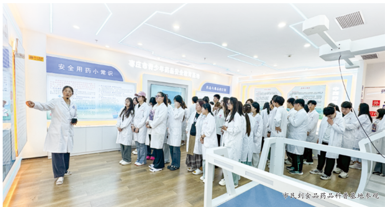
市民到食品药品科普基地参观