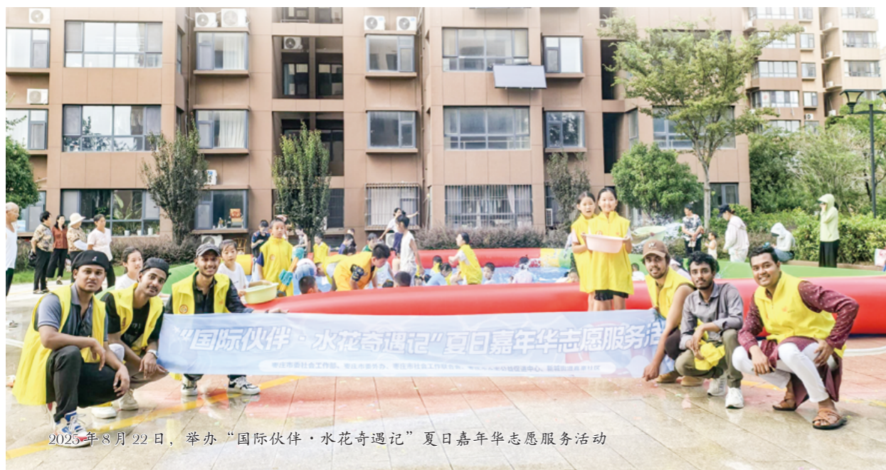
2025年8月22日，举办“国际伙伴·水花奇遇记”夏日嘉年华志愿服务活动