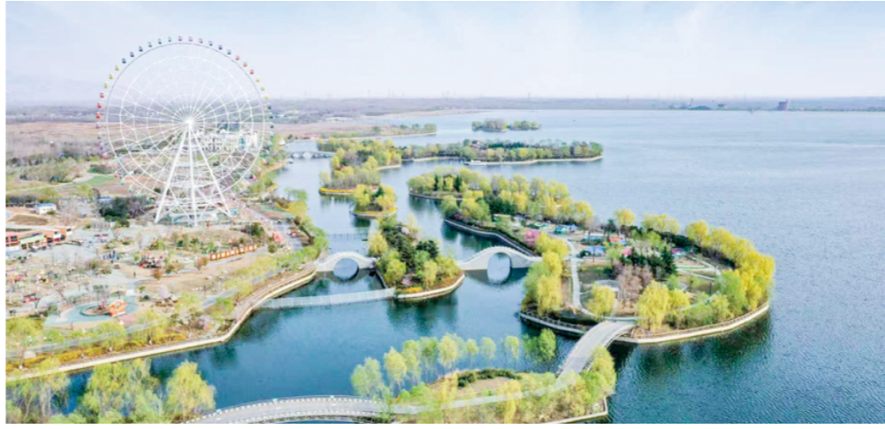
泰安弘泽担保公司担保支持泰安生态旅游项目——天颐湖景区

深耕科技金融，赋能创新驱动。聚焦高端装备产业、重点支持制造业隐形冠军企业、单项冠军企业、国家级专精特新“小巨人”企业融资需求，通过“市场化+政策性”融资担保双轮驱动，助力培育新技术、新产品、新业态，促进科技企业全链条生命周期、多元化接洽式融资需求与“一站式”担保服务供给双向匹配。截至2025年末，泰安弘泽担保公司累计为专精特新、隐形冠军、瞪羚企业，以及高新技术、创新型、科创型企业等提供融资担保支