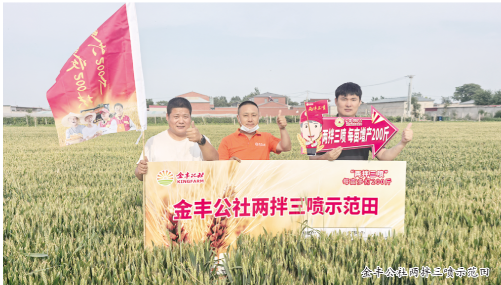
金丰公社两拌三喷示范田

汇聚全球智慧、深耕科技赋能、携手行业同行，金丰公社将始终高举农服大旗，以农服“加速度”深化齐鲁大地服务实践，为全国粮食大面积单产提升注入强劲动能！