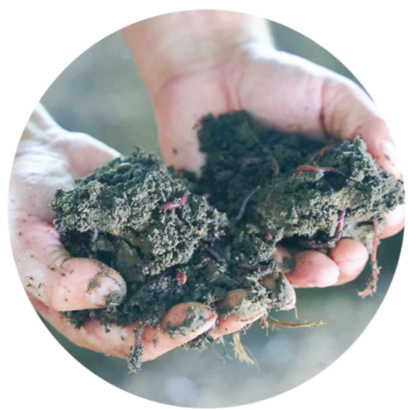
梁山城乡发展集团有限公司工作人员手捧湿润松软的“黑土”，红褐色的蚯蚓在其间灵活蠕动

中国建设银行山东省分行以扎实的行动作出回答。这答卷，不只书写于信贷合同之上，更铭刻于跨越天堑的隧道、重获新生的土地与焕发活力的山水之间。