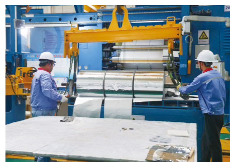
山东万通金属科技有限公司车间

建行滨州分行精准投放的2000万元贷款，成为撬动万通金属绿色升级的关键支点。这笔全省建行行业首单转型贷款，核心创新在于实现了环境效益与融资成本的动态挂钩，科学选定“吨铝碳排放强度”作为关键可持续发展绩效指标，精准量化企业减排成效，同时，推出贷款利率与减排绩效目标动态绑定机制。