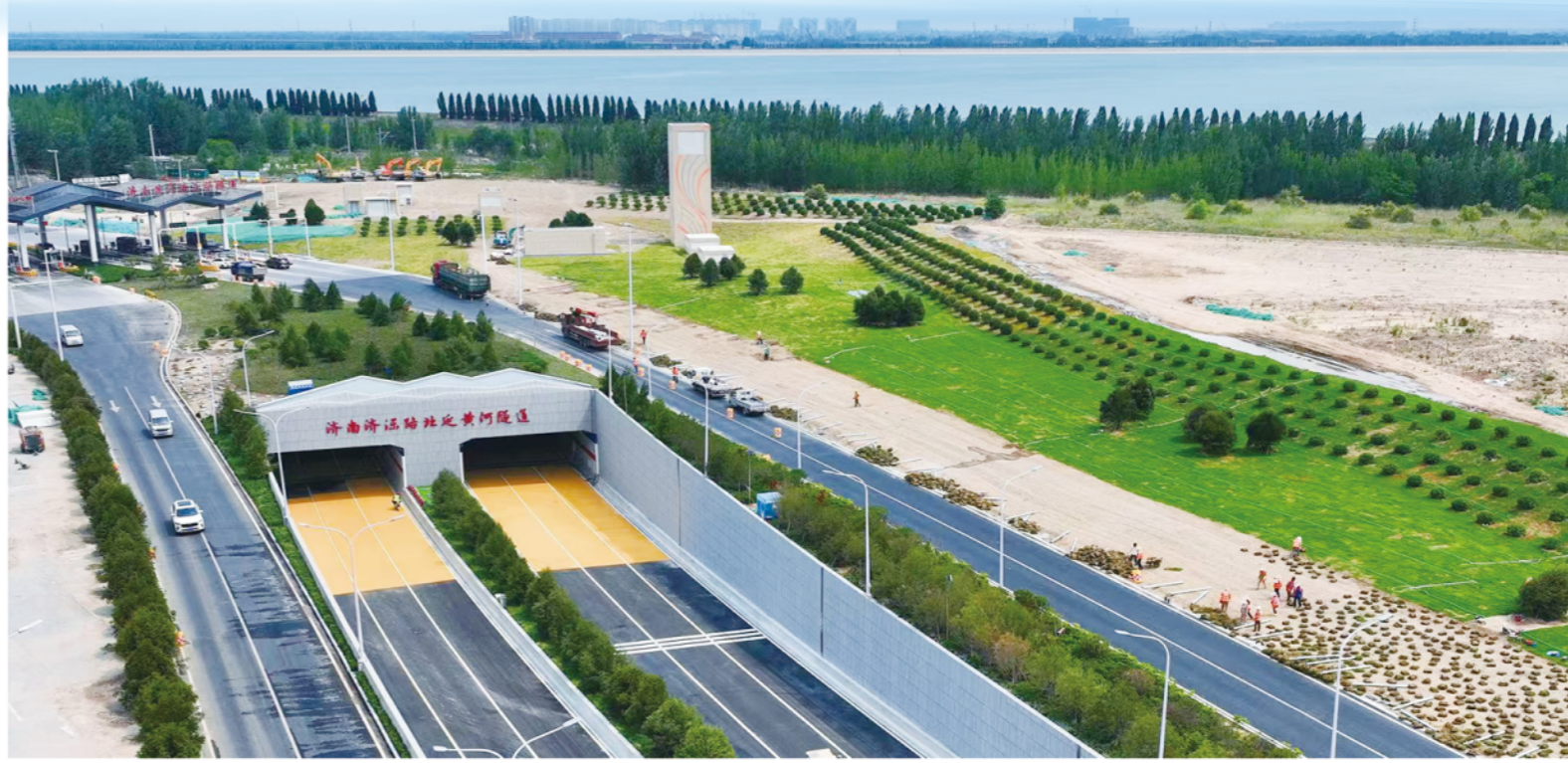
济南济泺路北延黄河隧道