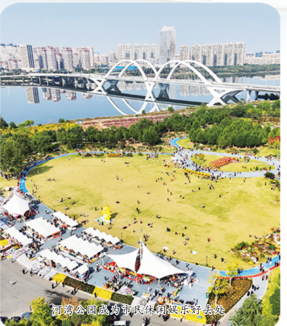
沂河公园盛湾市民休闲健身绿道开放