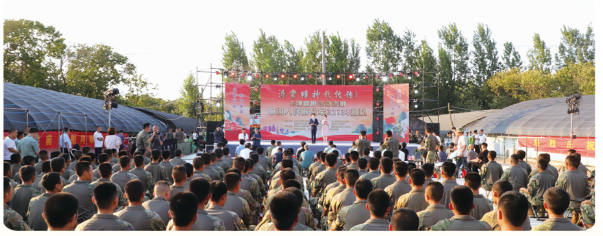
“沂蒙精神代代传”宣讲活动

人次，宣传报道全网阅读量超5.7亿，获得广泛好评。 最好的弘扬就是践行。围绕增进民生福祉，市级领导带头“四下基层、联县包乡”，厚植为民初心；扎实开展深入贯彻中央八项规定精神学习教育，集中整治群众身边不正之风和腐败问题，认真做好配合巡视、审计、生态环保督察等工作，政府系统全面从严治党进一步加强；打响“欢迎临沂、沂事无忧”营商环境品牌，纵深推进“高效办成一件事”，开展涉企第三方服务领域突出问题集中整治，创新构建企业分级分类监管机制；推动出台地方性法规3件，办理市人大代表建议347件，政协提案477件，召开市新闻发布会127场，政府工作更加公开透明。2025年12月29日，临沂发布《中共临沂市委关于进一步传承弘扬沂蒙精神的意见》，提出既要坚守党员本色、深化党群同心，也要从沂蒙精神中汲取力量、推动发展，让老区人民过上好日子。