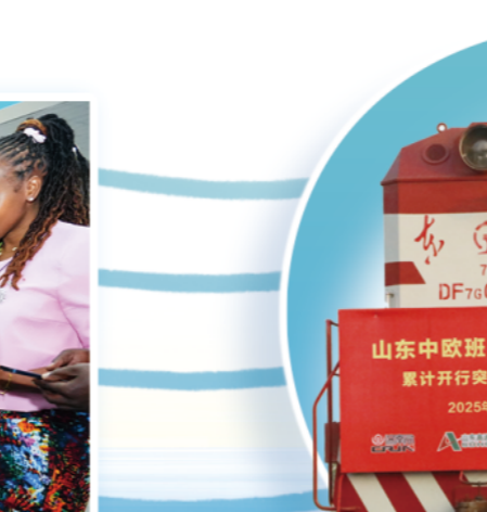
山东中欧班列（临沂）累计开行突破100列

“百团千金、商城出海”，2025年，临沂以前所未有的力度推进国际化数字化，全面对标义乌，2000多家企业“走出去”拓市场，新增外贸主体1600户，累计建成海外仓70处，对中亚出口增长33.6%，对非洲出口增长109.6%。临沂商城发展上升为省战略，省政府出台22项政策举措支持其高质量发展