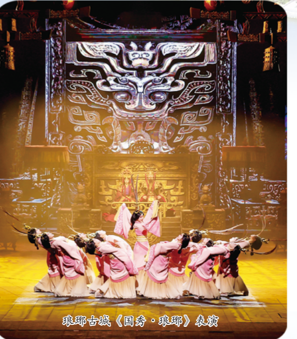
琅琊古城《国韵·琅琊》展演