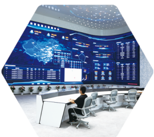
临沂商贸物流大数据平台