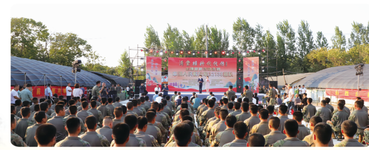
“沂蒙精神代代传”宣讲活动

为不断放大沂蒙精神影响力，传承和弘扬沂蒙精神，临沂策划系列传播活动，打造了具有全国影响力的“沂蒙精神代代传”主题宣讲品牌。坚持走出去，推动沂蒙精神宣讲进机关、进企业、进学校、进企业、进社区、进农村、进景区、进军营、进企业、进老区等，组织开展“沂蒙精神万里行”“沂蒙精神百校行”“全国大学生沂蒙精神志愿服务项目”等活动，先后到清华、北大、中国人民解放军仪仗大队和省军区等单位开展宣讲，累计覆盖全国100余座城市，500余家部门单位，600余所高校，宣讲1.1万余场次、线上线下受众224万余