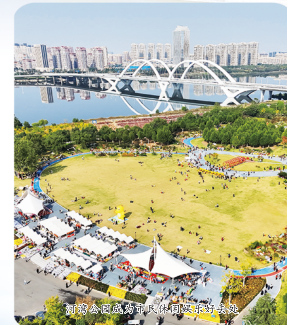
滨河公园盛湾市民休闲健身绿道