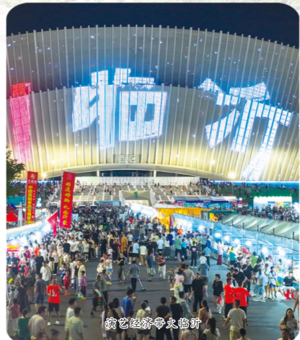
商贸经济繁荣临沂

坚持片区化建设，在推进乡村全面振兴上实现新突破。统筹规划一体、产业联动、设施共享、治理协同，推动乡村振兴从“点状突破”向“面上提升”，绘就生产、生活、生态“三生融合”的沂蒙乡村新画卷。因地制宜推进片区建设，实施片区提质增效行动，编制片区单体规划，新建示范区100个；深化“乡村振兴合伙人”计划，推动资源要素向片区集聚，落实四雁孵化“百千万”工程，培育四雁人才1.5万名以上，推动资源整合，产业升级，利益共享，打造高质量共富片区14个。筑牢更高水平“沂蒙粮仓”，严守耕地红线，推进耕地数量、质量、生态“三位一体”保护；实施粮油作物大面积单产提升行动，建设集中连片高产示范区，新建高标准农田25万亩，粮食播种稳定在970万亩、总产稳定在86亿斤。大力发展富民产业，做好“粮头食尾”“农头工尾”文章，梯次培育24个特色产业，建设标准化基地70个以上，新增省级以上农业龙头企业10家，让更多农产品增值收益留在农户、守牢不发生规模性返贫致贫底线，唱响“生态沂蒙山、优质农产品”公共品牌。完善乡村公共服务，实施新一轮农村公路提升行动，新建改建516公里；提升农村供水标准化管理水平，创建省级标准化水厂42处、小型供水工程114处；改造村卫生室441家，实现所有村卫生室达到省提升标准。深化人居环境整治，建立“美德积分+人居环境”长效管护机制，打造省级宜居宜业和美乡村18个。 此外，临沂市还在推动绿色低碳转型，着力解决群众急难愁盼，筑牢安全稳定发展转型，确保“十五五”开好局、起好步。