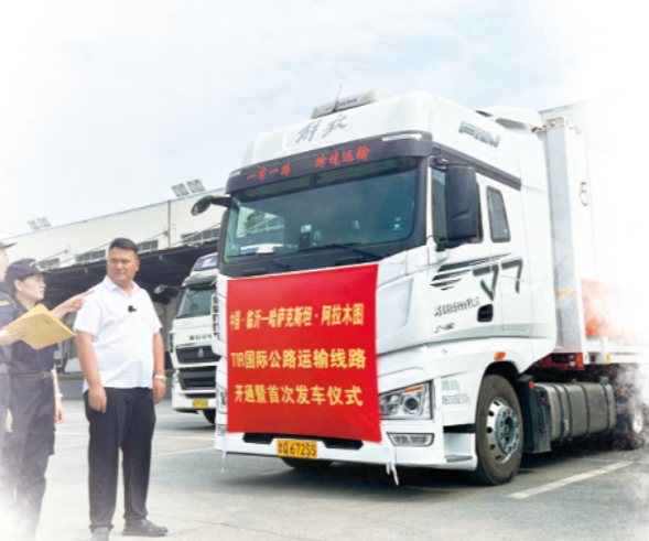
中国—临沂—哈萨克斯坦—阿拉木图TIR国际公路运输线路开通暨首次发车仪式

加快市场数字化。分类推进136处专业批发市场“人、货、场、链”要素升级重构，提升重点物流园区智能化水平。做优“中国大集”平台，力争业务规模翻倍。抓实物流大数据平台，加快整合各类数据资源。做强“沂链通”平台，打造供应链票据生态建设示范市。