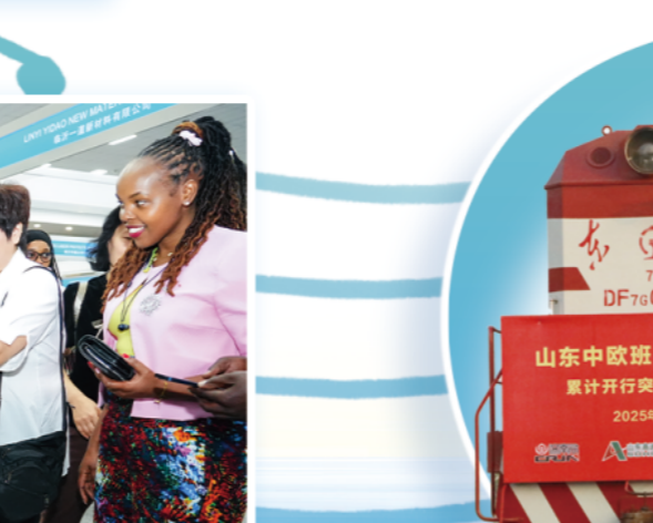
山东中欧班列（临沂）累计开行突破100列

“百团千企·商城出海”，2025年，临沂以前所未有的力度推进国际化数字化，全面对标义乌，2000多家企业“走出去”拓市场，新增外贸主体1600户，累计建成海外仓70处，对中亚出口增长33.6%，对非洲出口增长109.6%。临沂商城发展上升为省战略，省政府出台22项政策举措支持其高质量发展