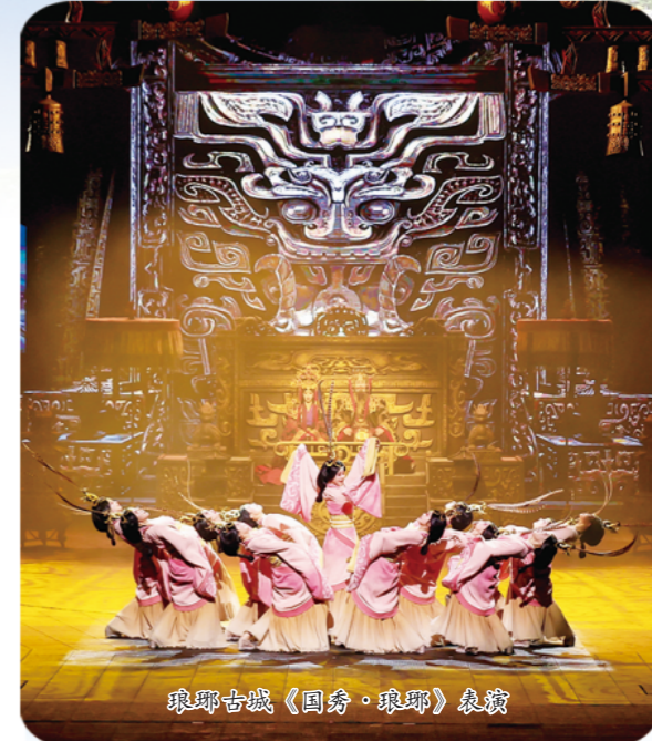
琅琊古城《国韵·琅琊》展演