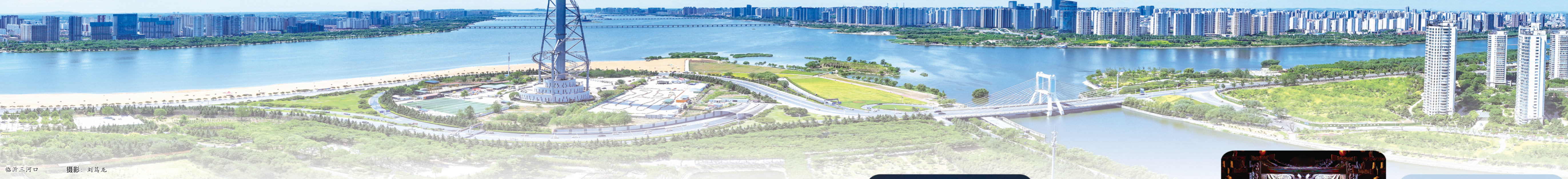
临沂三河口

就业、稳企业、稳市场、稳预期，推动经济实现质的有效提升和量的合理增长，保持社会大局和谐稳定，确保实现“十五五”良好开局。