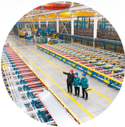
国网潍坊供电公司工作人员上门走访用电企业，协助排查用电隐患

经济发展，电力先行。“十四五”期间，国网潍坊供电公司深入贯彻落实国网山东省电力公司和潍坊市委、市政府工作部署，主动践行“人民电业为人民”企业宗旨，持续优化电网布局，转变发展方式，创新服务模式，在服务经济社会高质量发展、助力乡村振兴、提供优质供电服务等方面发挥“顶梁柱”作用，为全市经济社会高质量发展和人民美好生活提供安全可靠的电能保障。