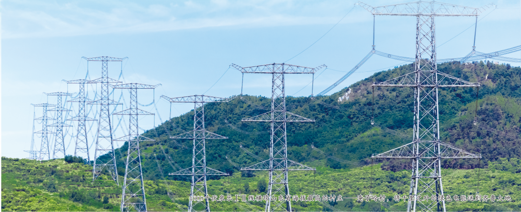
1000千伏胶济东Ⅱ线横跨山东省海拔最高的村庄——尧子岭村，将千里之外的绿色电能送到齐鲁大地