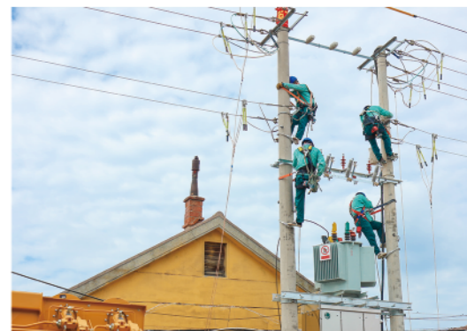
国网潍坊供电公司员工对10千伏孔义庄二村3号台区进行升级改造

坚强的电力保障带动了乡村产业发展。潍坊高密夏庄镇东李村是闻名全国的红纸对联加工专业村，被誉为“江北红纸第一村”。该公司为村里新上3台400千伏安变压器，将1台160千伏安的变压器增容至400千伏安。电足了，东李村红纸产业逐步做大，每年刷8000吨对联、红纸，人均年收入9万元以上。在潍坊，因电受益的村庄、因电而兴的产业不胜枚举，昌乐东南村依靠坚强电网发展起了电商经济，将该村打造成为闻名全省的“淘宝村”；昌邑院头村发展纺织产业，稳定电