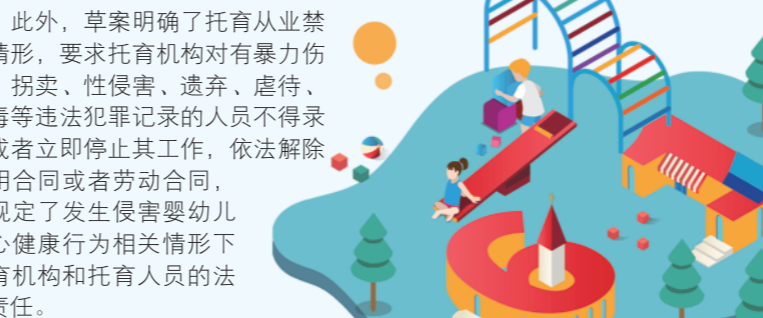
制图：唐亚迪

草案明确托育机构的设立条件，实行准入许可，并要求托育机构建立信息公示制度、建立健全安全管理制度。同时，草案严格托育人员任职资格条件，明确“实行托育师资格考试和注册制度”，并规范托育服务内容。草案还明确，“国家建立托育服务标准体系”，“县级以上地方人民政府卫生健康主管部门应当对托育机构的服务质量定期组织评估，并将评估结果向社会公布”。