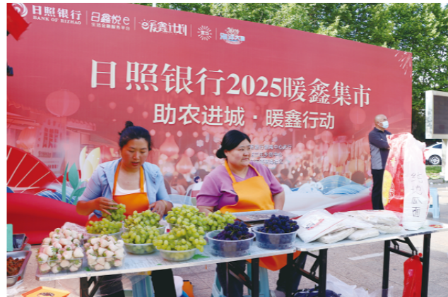
2025年5月17日，两名商户在日照银行“暖鑫集市”售卖水果等农产品

日照安东卫第一海产品批发市场是全国最大的海产品交易市场，以虾皮、籽乌、海米、海参、东南亚虾、南美鲑鱼为主要交易品类。每逢农历“一、六”，商户赶集摆摊，市场交易活跃，但也普遍面临短期资金周转压力。日照银行深入分析交易量较大的虾皮、籽乌、海参3类产品经营模式，将客群细分为零售商、电商、一级批发商、二级批发商等多种类型，结合行内风控模型，将商户交易流水转化为信贷信用，实现“无感授信、精准触达”。全程手