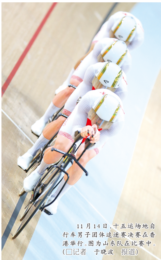
11月14日，十五运场地自行车男子团体追逐赛决赛在香港举行。图为山东队在比赛中。