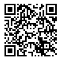
扫码观看视频报道

发展这一首要任务,在“稳”的基础上奋力求“进”,在“进”的征程中持续夯实“稳”,书写更加精彩更加辉煌的“滨州篇章”。