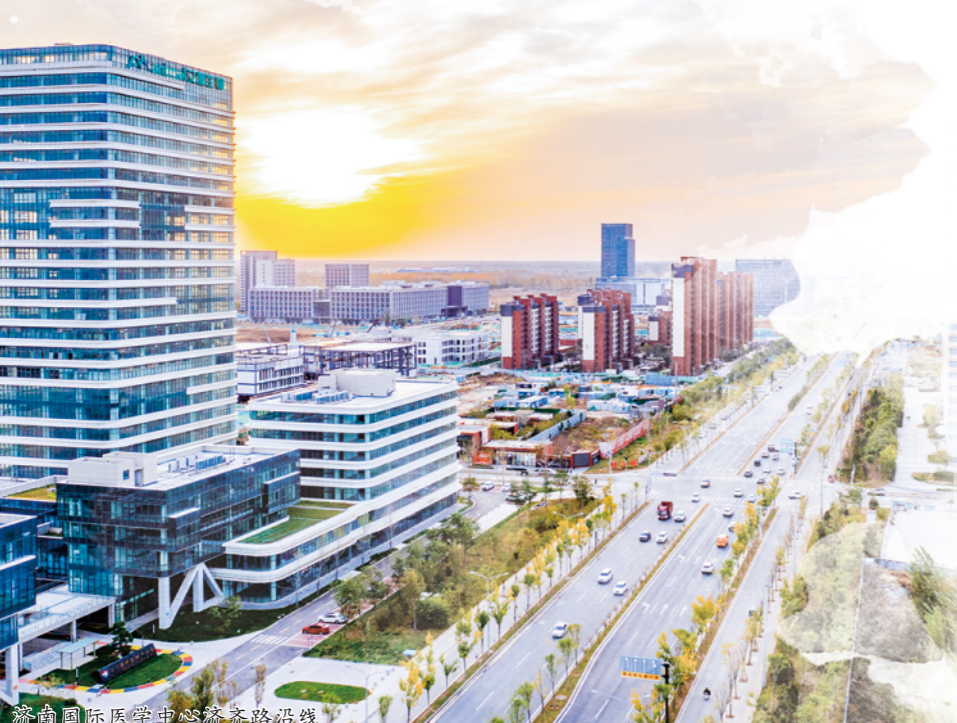
济南国际医学中心齐鲁路沿线