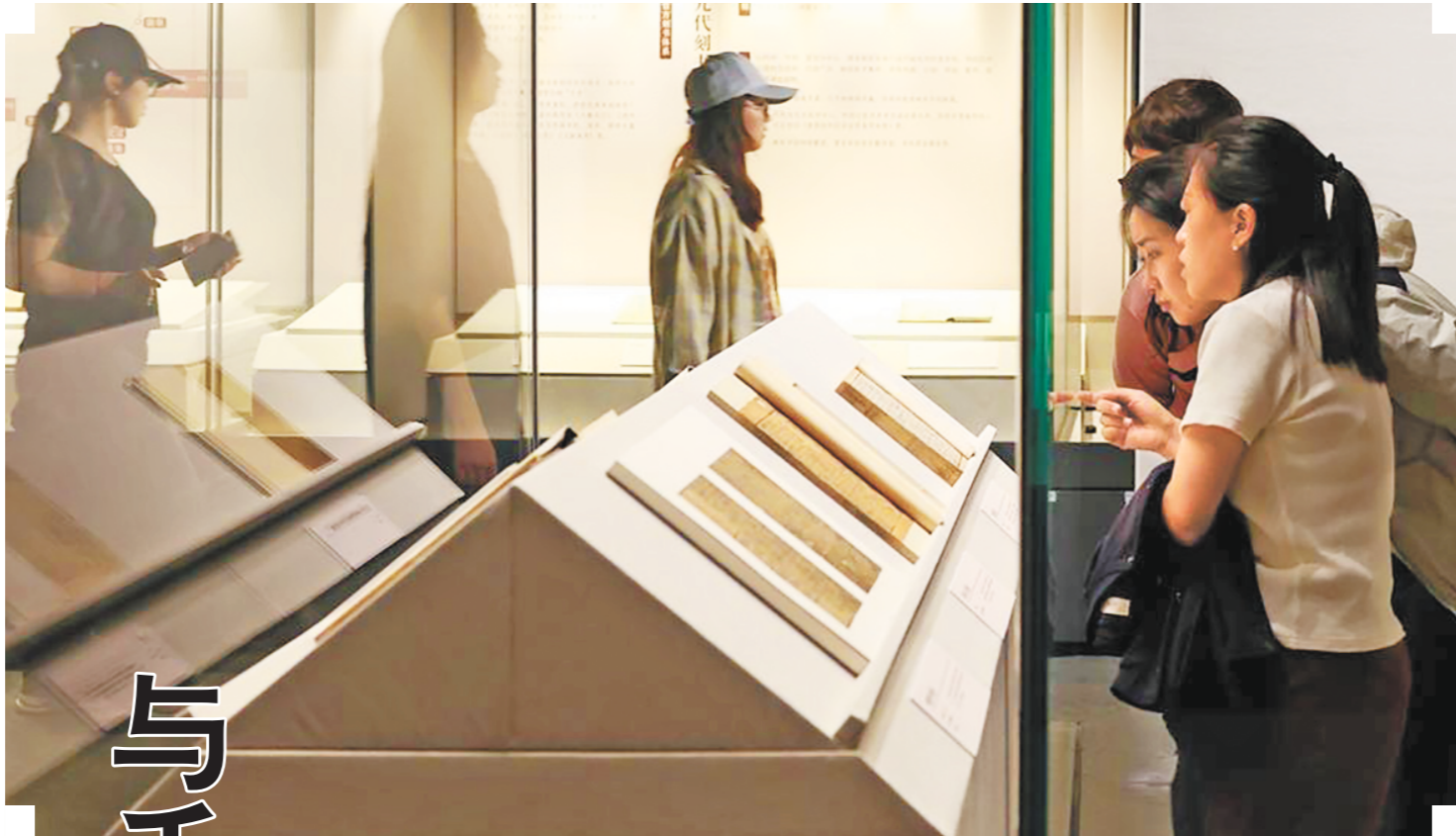
“鲁壁重光:唐宋元珍贵古籍特展”现场。

最后是做工好。宋代刻工刀法纯熟,能把毛笔字的转折顿挫呈现在雕版上,印出来的字跟手写的高度相近。在材料上,墨用的是上等墨,色黑如漆,千年不褪色;纸要么是皮纸,要