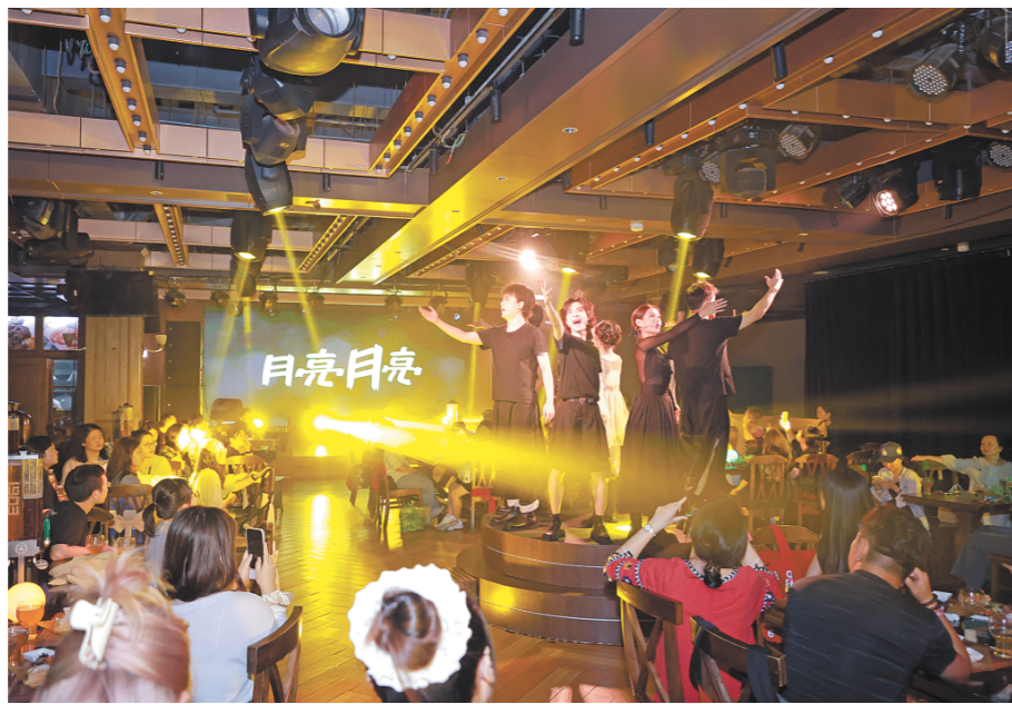
青岛啤酒博物馆推出的戏剧《月亮 月亮》演出场景。

今年国庆中秋假期,青岛啤酒博物馆以“月满酒满,双节同欢”为主题,推出系列文化体验活动。其中,《月亮 月亮》由青岛啤酒博物馆与龙马社创意打