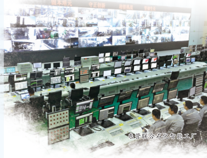
东营联合石化智能工厂