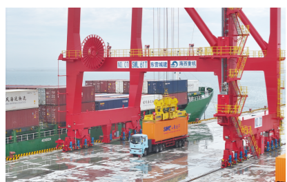
东营首个专业化集装箱码头开港首航

8月17日，随着拖轮的缓缓驶离，由澳大利亚出发，运载8.8万吨铝矾土的“天秤座”轮，稳稳靠泊东营港一突堤10万吨级通用泊位，标志着东营港通用码头泊位顺利实现外贸首航，为东营港建设亿吨深水大港、打造全国主要港口和国家级能源保障港奠定基础。