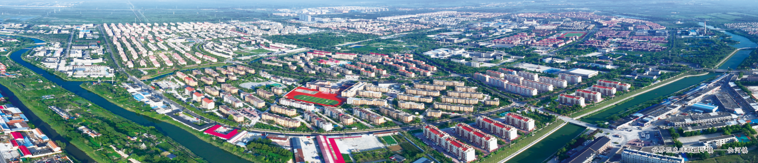
世界匹克球联盟小镇—仙河镇

“无项目不开发区，无项目不东营港。”在东营港和港口腹地，一个个重点项目如雨后春笋正在向下扎根、向上拔节，奋力生长。目前，东营港经济开发区正加快推进富海、鸿丰、亚通3个总投资超千亿元的延链补链强链产业项目，为东营港能级提升、跨越发展提供强大支撑。与此同时，开发区内10万吨海水淡化综合利用、万达海缆扩容升级、山能海上风电等项目的实施，正推动海洋产业成形起势。