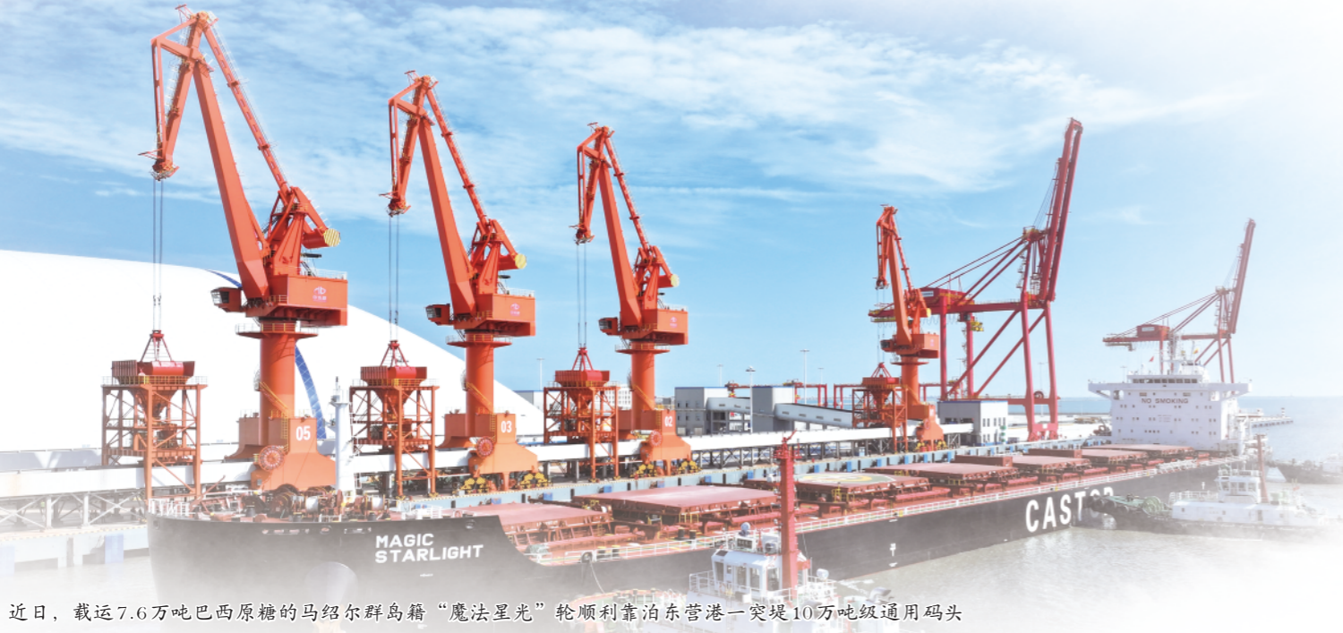
近日，载运7.6万吨巴西原糖的马绍尔群岛籍“魔法星光”轮顺利靠泊东营港一突堤10万吨级通用码头