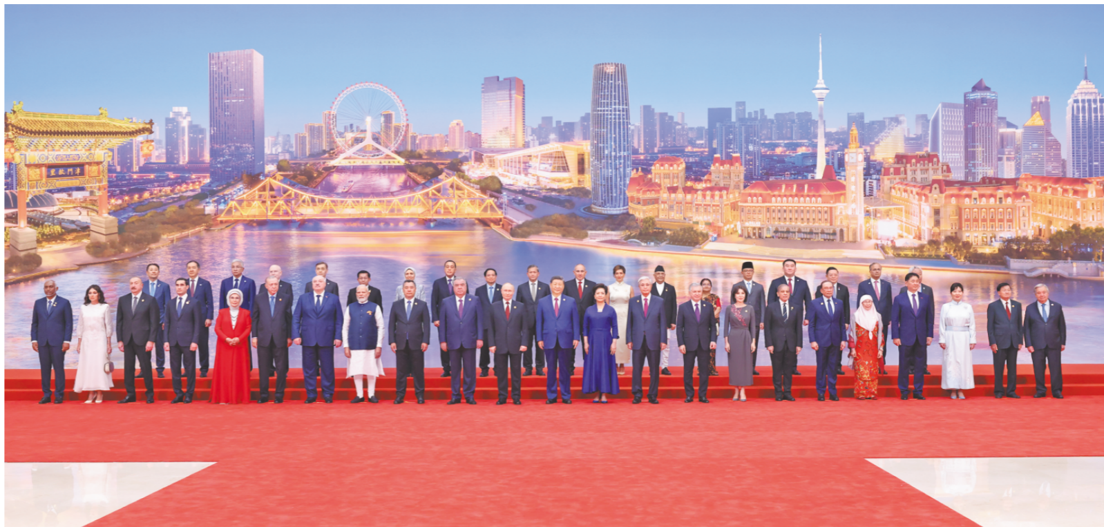
□新华社记者 黄敬文 报道

8月31日晚，国家主席习近平和夫人彭丽媛在天津梅江会展中心举行宴会，欢迎来华出席2025年上海合作组织峰会的国际贵宾。这是习近平发表致辞。