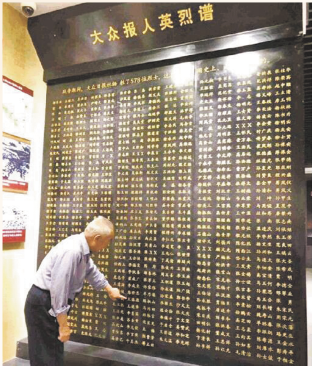
“大众报人英烈”纪念墙上，用金字镌刻着战争年代牺牲的578位烈士的英名。图为一位老人在纪念墙上寻找亲属的名字。（□资料图）

大众日报是英雄的报纸，红色是大众日报的底色。诞生于抗战烽火中的大众日报，流淌着红色血液，传承着红色基因。 大众日报社陈列馆内，“大众报人英烈”纪念墙肃然矗立，大理石面上用金字镌刻着578个名字。每一个名字背后，都有一段可歌可泣的英雄故事。从1939年创刊到新中国成立期间的十年间，578名大众报人为党和人民的事业献出了宝贵的生命，其中抗日战争期间牺牲的同志有223位。他们之中，有领导干部，有记者编辑，也有工人、战邮员。他们用鲜血染成的“大众红”，是世界新闻史上少有的史诗级篇章；他们的英雄壮举，是伟大抗战精神和沂蒙精神的生动诠释。 天地英雄气，千秋尚凛然。578位英烈，都是光荣的新闻战士、民族英雄。他们的名字，将永远被铭记——