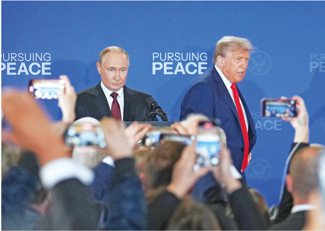
8月15日，美国总统特朗普（右）与俄罗斯总统普京（左）在美国阿拉斯加州安克雷奇市埃尔门多夫-理查森联合军事基地举行会晤后共同出席联合记者会。