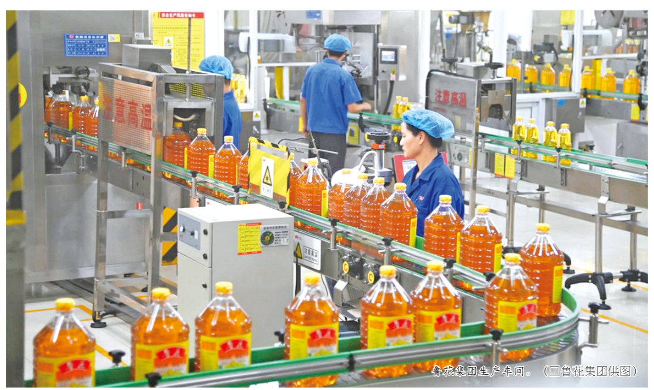
鲁花集团生产车间。

高油酸花生不仅亩产高，每吨收购价格也比普通花生高出1000—1500元。目前，鲁花集团在山东、河南、江苏、辽宁、内蒙古等地建设高油酸花生种植产业集群，发展了10万多亩良种繁育基地和1000多万亩种植原料基地，带动农民致富的同时，也从源头上保障了花生油的食用安全。只实现种子破局还远远不够，加工