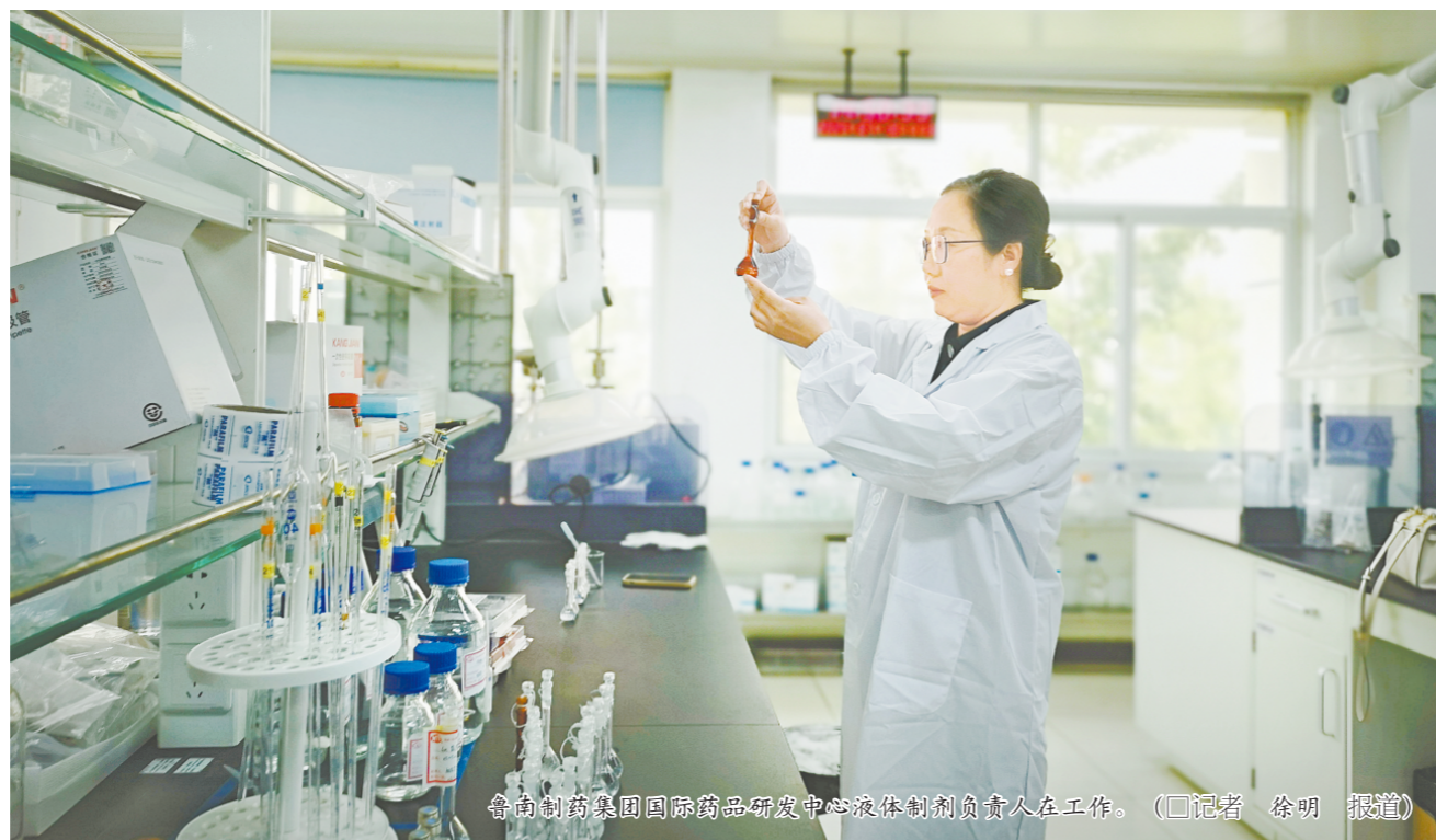
鲁南制药集团国际药品研发中心液体剂负责人在工作。（□记者 徐明 报道）

为此，鲁南制药构建了“以企业为主体、以市场为导向、以满足临床需求为目的”的创新生态，5个国家级科研平台和11个省级平台，覆盖化学药、中药、生物药三大领域，每年