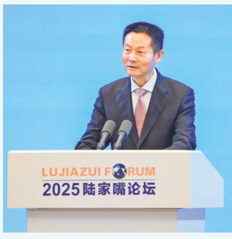
6月18日，中国证监会主席吴清在2025陆家嘴论坛上。

迎外资机构深度参与中国科技金融、数字金融实践，支持外资机构广泛参与中国绿色金融市场。希望更多外资机构积极参与养老理财、养老储蓄、专属养老保险和商业养老金试点，更好发挥产品设计、保险精算、投资管理等专业优势。支持外资机构在理财投资、资产配置、保险规划等领域加大布局，更好满足客户财富保值增值等综合化金融需求。