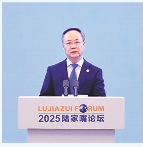
6月18日，金融监管总局局长李云泽在2025陆家嘴论坛上。

八是会同证监会研究推进人民币外汇期货交易。推动完善外汇市场产品序列，便利金融机构和外贸企业更好管理汇率风险。