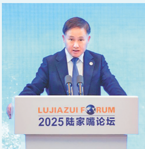
6月18日，中国人民银行行长、论坛共同轮值主席潘功胜在2025陆家嘴论坛上。

论坛首日，一行一局一会（中国人民银行、国家金融监督管理总局、中国证监会）“一把手”的发声，都发布了哪些金融政策？传递了怎样的信号？