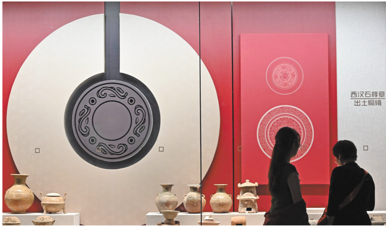
5月2日，游客在滕州汉画像石馆内参观。

如果说大馆是顶级国宝的“群英荟萃”，那么中小博物馆则蕴含了更多历史细节，是“文明拼图”不可缺少的组成部分。近年来，中小博物馆日益受到游客的青睐，除了藏品本身的稀缺性，还得益于博物馆在藏品资源挖掘、技术应用以及发展模式等方面的不断创新。（下转第二版）