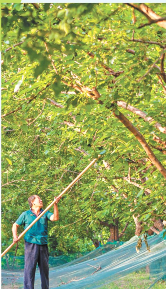
夏津黄河故道古桑树群