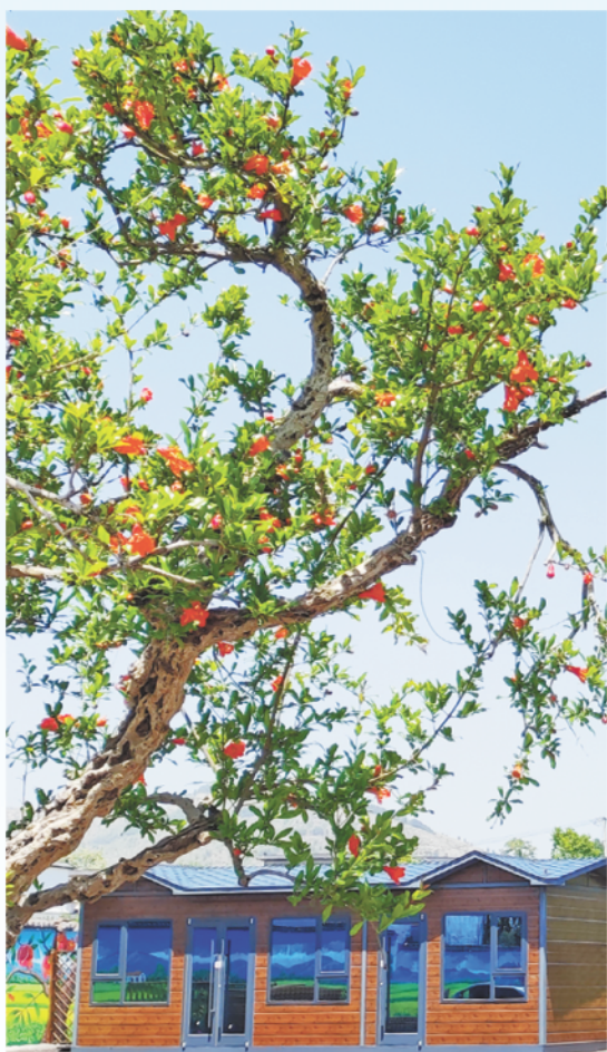
枣庄冠世园·榴光溢彩乡村振兴示范片区