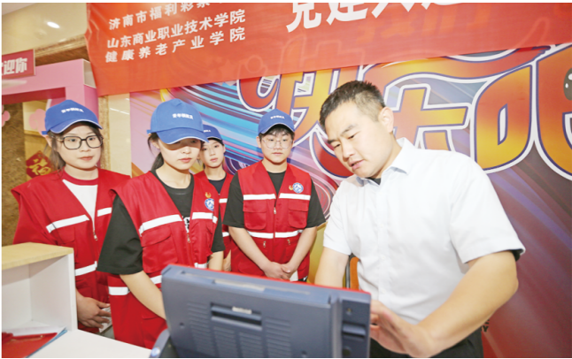
开展青年创业实践活动，为渠道转型升级赋能