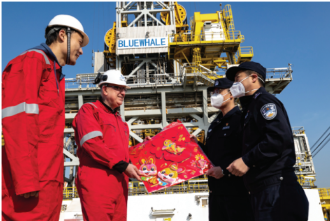
烟台港“蓝鲸二号”平台上，执勤一队民警为外籍船员送上代表春节祝福的大红“福”字。